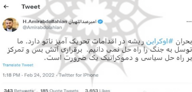
شکل (۳): توییت حسین امیرعبداللهیان در تاریخ ۲۴ فوریه ۲۰۲۲ درباره بحران اوکراین.

پس از تهاجم روسیه به اوکراین در سال ۲۰۲۲، روابط ایران و روسیه به دلیل تحریم‌های شدید غرب علیه هر دو کشور بیش از پیش تقویت شده است. هر دو کشور گسترش ناتو را تهدیدی برای منافع خود می‌دانند. برای ایران، پیوستن کشورهایمانند ارمنستان و آذربایجان به ناتو می‌تواند نفوذ این کشور در قفقاز را کاهش داده و امنیت ملی‌اش را به خطر اندازد. از این‌رو، ایران همکاری نزدیک با روسیه را برای مقابله با این تهدید در اولویت قرار داده است. سفیر ایران در روسیه در تاریخ ۹ اسفند ۱۴۰۰ اظهار داشت که ایران و روسیه گسترش ناتو را در راستای منافع خود نمی‌بینند (Radio Farda, 2022) همچنین، مشاور تیم مذاکره‌کننده ایران در ۱۴ آبان ۱۴۰۱ ناتو را مقصر اصلی بحران اوکراین دانست (Donya-e-Eqtasad, 2022) وزیر امور خارجه سابق ایران نیز در ۲۴ فوریه ۲۰۲۲ در توییتی تأکید کرد که ریشه بحران اوکراین به اقدامات تحریک‌آمیز ناتو بازمی‌گردد (Iranian Foreign Minister's Twitter Account, 2022).