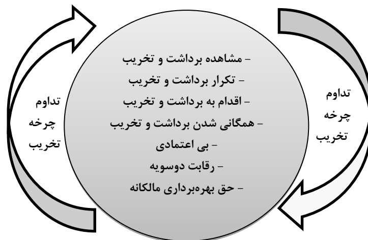
شکل ۳: پیامدهای تخریب محیط‌زیست بر رفتارهای محیط‌زیستی روستاییان