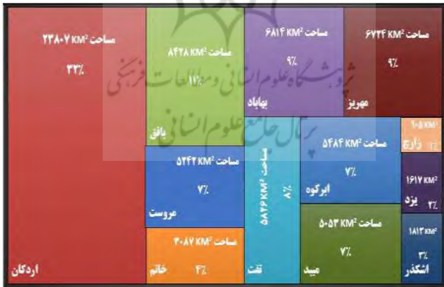
شکل ۱- مساحت (کیلومتر مربع) شهرستان‌های استان یزد بر اساس تقسیمات سیاسی سال ۱۴۰۱