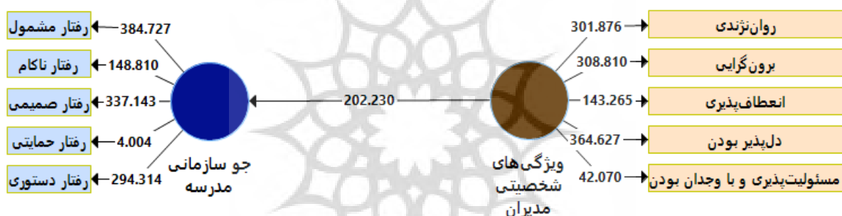
شکل ۲. مقادیر بوت استرپ تأثیر ویژگی های شخصیتی مدیران و معلمان بر جو سازمانی مدارس متوسطه

با عنایت به داده های شکل ۱ و شکل ۲، ضریب مسیر تأثیر ویژگی های شخصیتی مدیران و معلمان بر جو سازمانی مدارس متوسطه معنی دار است. همچنین، تمام مقادیر پایایی ترکیبی (اعداد داخل دایره) بیشتر از \frac{0}{6} هستند. علاوه بر این، مقدار بوت استرپ تأثیر ویژگی های شخصیتی مدیران و معلمان بر جو سازمانی مدارس متوسطه گزارش شده در روی خطوط مسیر در سطح 0/01 معنی دار هستند. بر این اساس، تأثیر ویژگی های شخصیتی مدیران و معلمان بر جو سازمانی مدارس متوسطه از حیث مقدار آماره t-value تأمین است. به عبارت دیگر، مقدار بوت استرپ، مقدار بالای \frac{2}{58} را به خود اختصاص داده است. بنابراین، نتیجه گیری می شود، ویژگی های شخصیتی مدیران و معلمان بر جو سازمانی مدارس متوسطه تأثیر دارد.