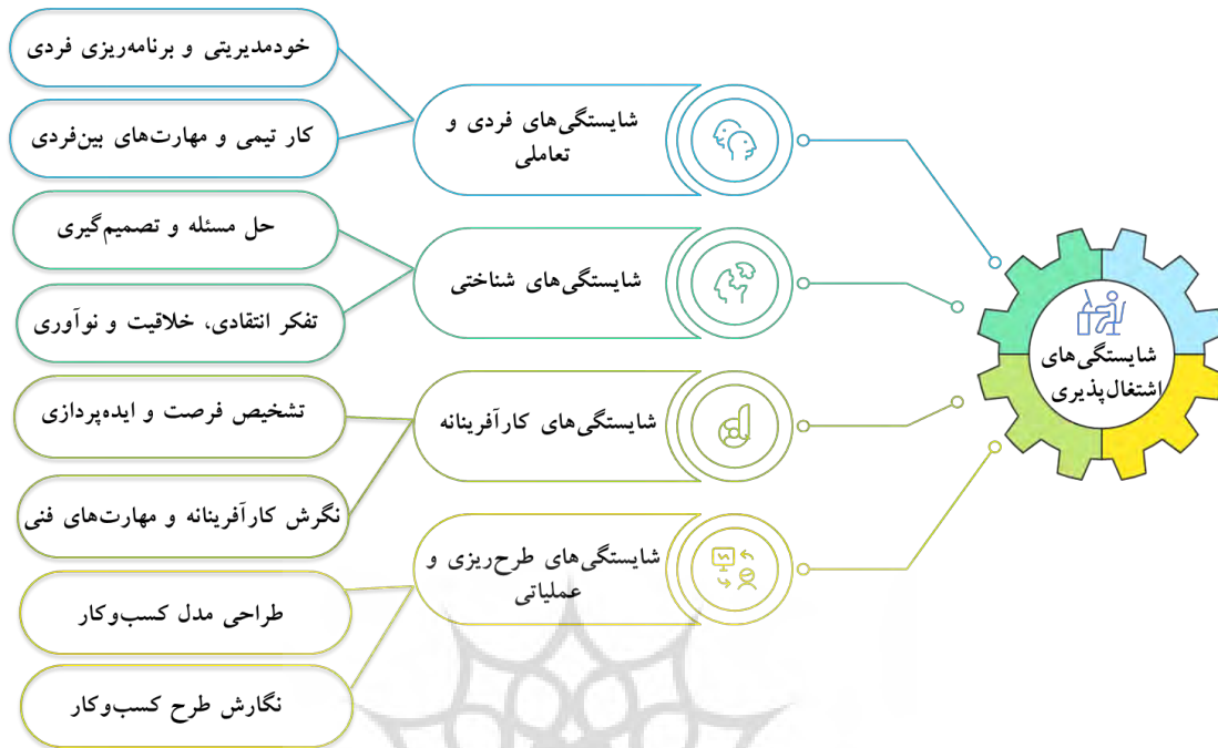
شکل ۲. شایستگی‌های اشتغال‌پذیری در کتاب کارگاه کارآفرینی و تولید