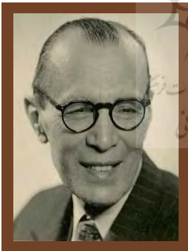
ملک الشعراء محمدتقی بهار

از منظر اندیشه‌شناسی، بهار از اصیل‌ترین شاعران ملی‌گرای زبان فارسی است. دغدغه اصلی او در تمامی اشعارش «ایران» است. او تنها یک شاعر زیبایی‌پرداز نبود، بلکه به تمام رویدادها و حوادث زمانه‌اش واکنش نشان می‌داد و موضع‌گیری سیاسی می‌کرد. حضورش در جریان مشروطه، یکی از ارکان اصلی جریان‌های فکری و ادبی آن دوران بود. شفیعی کدکنی در این باره می‌نویسد: «اگر دو نهنگ بزرگ از شط‌شعر بهار بخواهیم صید کنیم، یکی مسئله وطن است و دیگری آزادی. بهترین ستایش‌ها از آزادی در آثار بهار وجود دارد و زیباترین ستایش‌ها از مفهوم وطن، باز هم در دیوان او به چشم می‌خورد.» (شفیعی کدکنی، ۱۳۸۰: ۳۵) شعر بهار با آنکه به مکتب شعری سنتی نزدیک است، توانست خود را با خواسته‌های ملت هماهنگ سازد، با مردم و رویدادهای زمانه همسو شود و بر تفکرات جامعه تأثیر عمیقی بگذارد (آرین‌پور، ۱۳۸۸). در این نوشتار، با تورقی بر دیوان استاد بهار، برخی شخصیت‌ها و رویدادهایی را که او در اشعارش بازتاب داده بررسی می‌کنیم و چهره ایران و ایرانیان عصر وی را از خلال آن اشعار آشکار می‌سازیم.