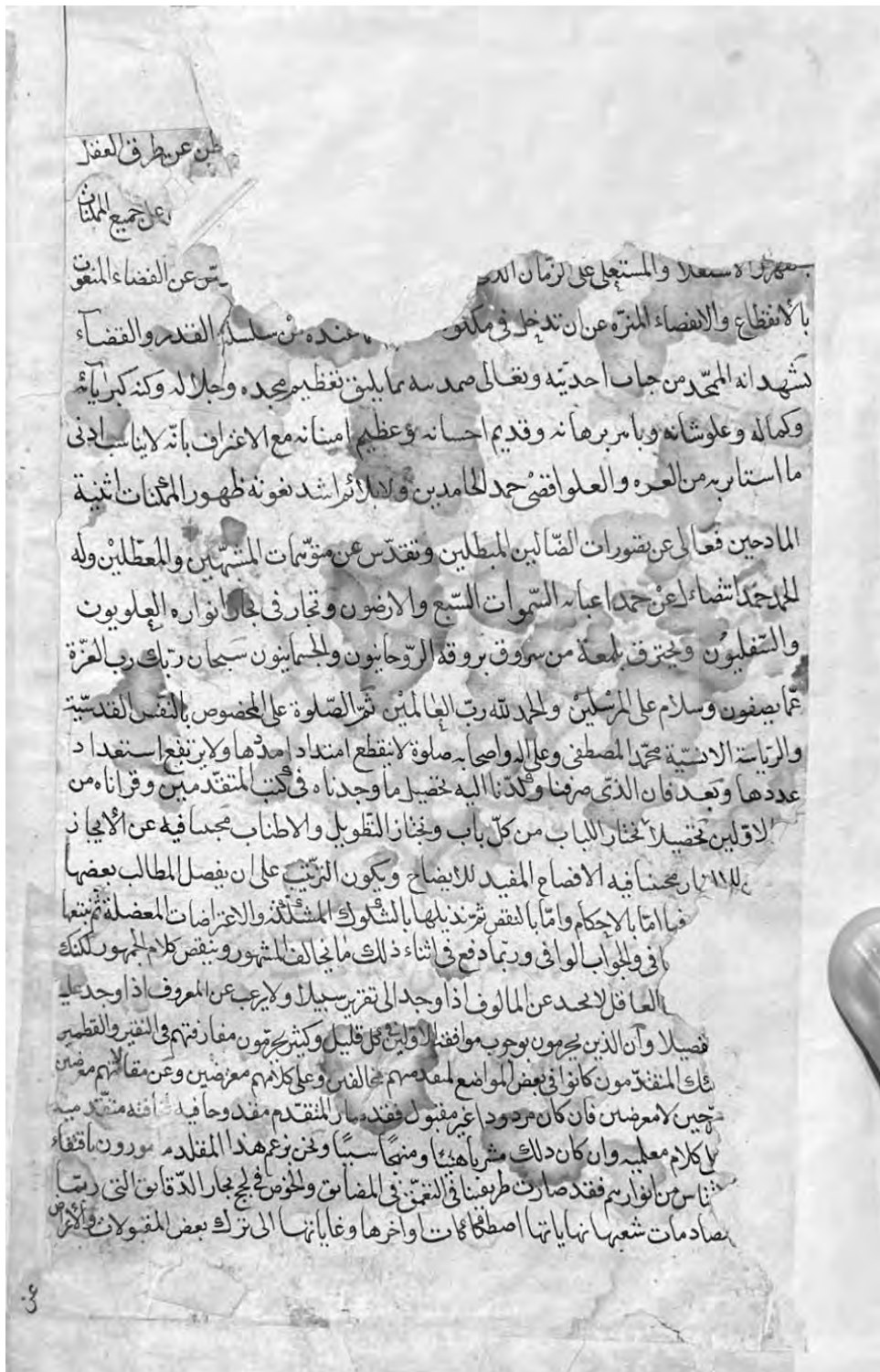
- صفحه اول متن المباحث المشرقیه، خط نویس، ظاهراً متعلق به