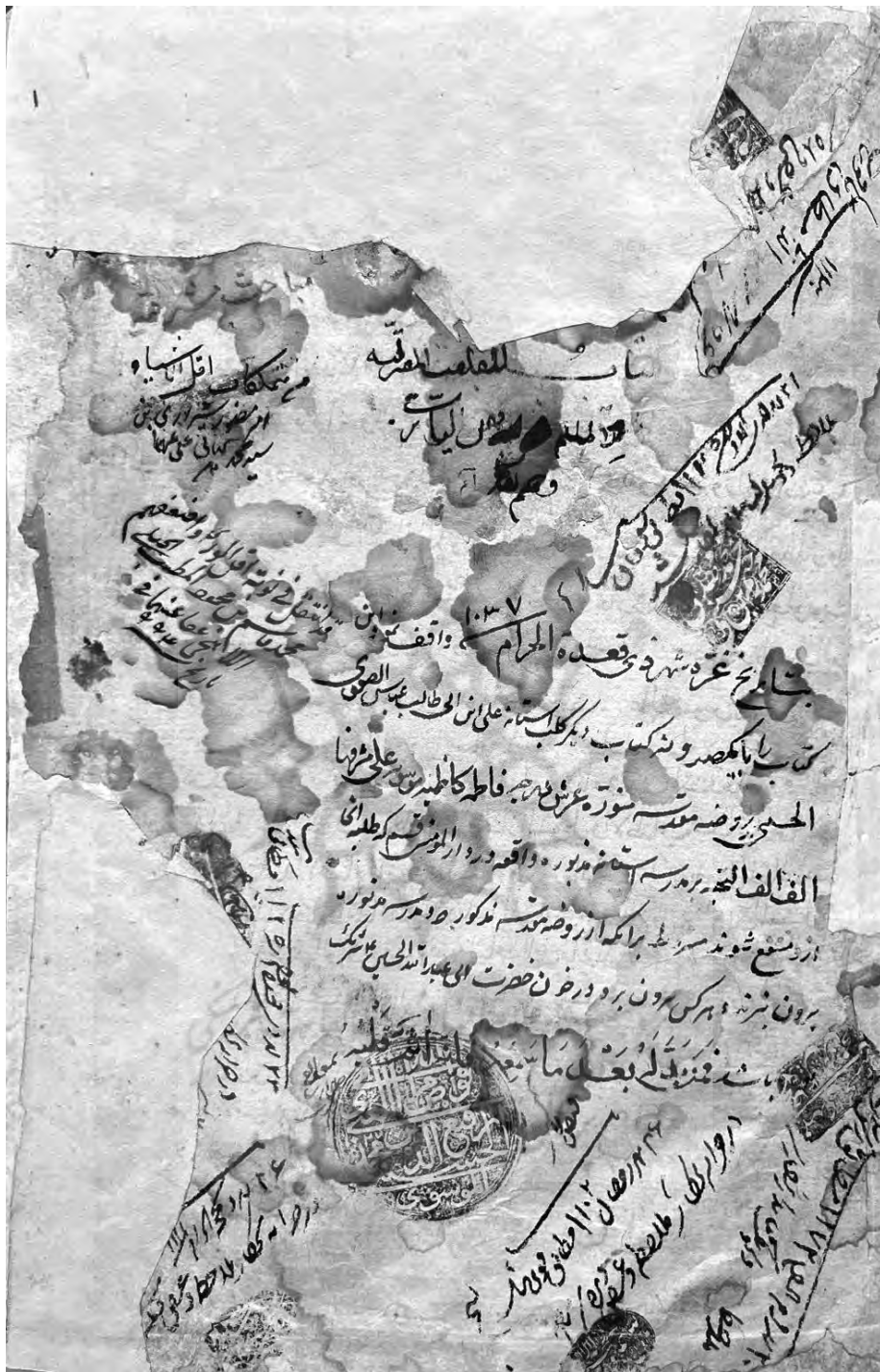
- سال ۱۴۰۳. وقف نامه المباحث المشرقیه که نشان از آسیب دیدگی دارد.