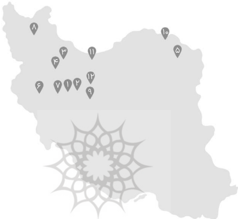
تصویر ۱. نقشه پراکندگی روستاهای مورد مطالعه در سطح کشور

از میان ۱۱ استان مختلف انتخاب شده‌اند و نواحی مختلف شمالی و شرقی و غربی و مرکزی کشور را پوشش می‌دهند.