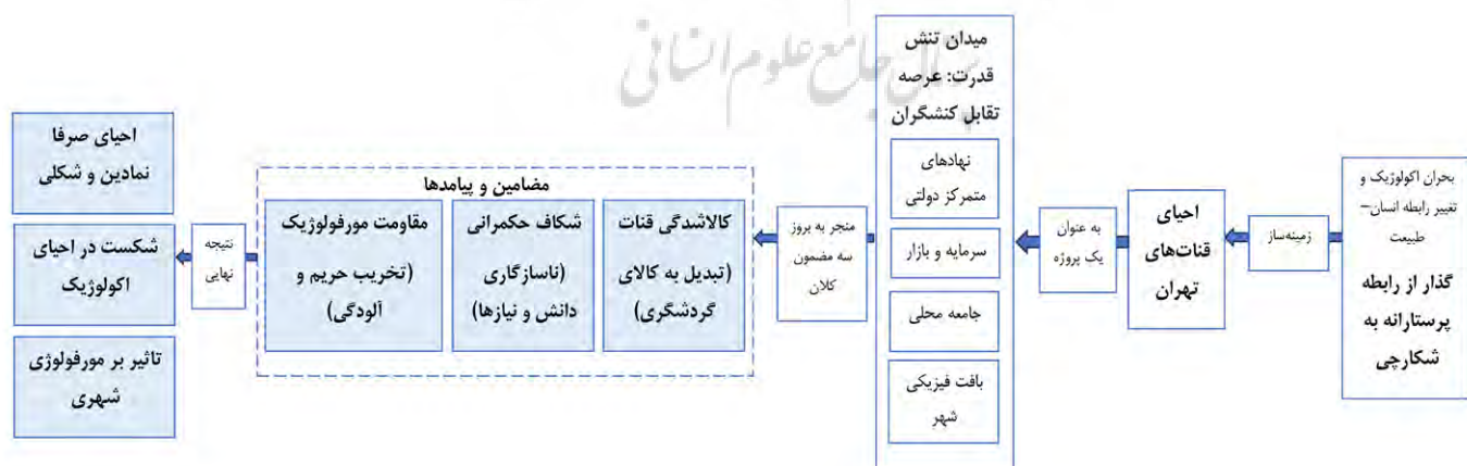
تصویر ۴: مدل مفهومی روابط بین مضامین اصلی پژوهش

تصویر ۴، روابط بین این مضامین را در قالب یک مدل مفهومی نشان می‌دهد. این الگو روابط چندبعدی بین عوامل اجتماعی، سیاسی، محیط‌زیستی و فنی در فرایند احیای قنات را نشان می‌دهد و بر تعاملات قدرت، ساختار فضایی، و دگرگونی رابطه انسان و محیط تمرکز دارد. مدل مفهومی پژوهش از راست به چپ و براساس منطق علی-زمینه‌ای متن، ترسیم شده است. نقطه آغازین (سمت راست) بستر کلان (بحران اکولوژیک و تغییر رابطه انسان و طبیعت) به‌عنوان زمینه و عامل اصلی که ضرورت «احیای قنات‌های تهران» را ایجاد می‌کند، هسته مرکزی مدل (میدان تنش قدرت) است که این پروژه در یک فضای خنثی اتفاق نمی‌افتد، بلکه بلافاصله به یک عرصه تقابل بین چهار کنشگر اصلی تبدیل می‌شود که شامل نهادهای متمرکز دولتی (با اولویت‌های حکمرانی از بالا به پایین)، سرمایه و بازار (با انگیزه کالاسازی و سودآوری)، جامعه محلی (با نیازهای زیستی-اجتماعی و دانش بومی)، بافت فیزیکی شهر (به‌عنوان یک کنشگر غیرانسانی که قوانین خود را تحمیل می‌کند). خروجی‌های میدان تنش (مضامین اصلی)، تقابل این کنشگران در میدان قدرت، خود را در قالب سه مضمون یا چالش اصلی نشان می‌دهد که شامل کالاشدگی قنات: نتیجه غالب شدن گفتمان بازار و نهادهای متأثر از آن، شکاف حکمرانی: نتیجه تقابل گفتمان نهادهای متمرکز با جامعه محلی، و مقاومت مورفولوژیک: نتیجه بی‌توجهی به قوانین اکولوژیک و فیزیکی حاکم بر بافت شهر است. نتیجه نهایی در مدل مفهومی براینده این سه مضمون و ادامه تقابل در میدان قدرت، منجر به نتیجه‌ای سه‌گانه می‌شود: احیای قنات در سطح نمادین و شکلی (مثلاً به‌صورت موزه) که در عمل در بازسازی کارکرد اکولوژیک و اجتماعی آن شکست می‌خورد و در عین حال بر مورفولوژی شهر تأثیر می‌گذارد.