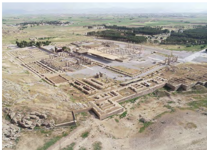
تصویر ۳: نمای عمومی میراث جهانی تخت جمشید دید به سمت دشت مرو دشت

با وجود این ظرفیت‌ها و اهمیت‌ها، منطقه مرو دشت در سال‌های اخیر با مجموعه‌ای از چالش‌های فزاینده مرتبط با تغییرات آب‌وهوایی مواجه شده است. کاهش بارندگی، تداوم دوره‌های خشکسالی، افت منابع آب سطحی و زیرزمینی، گسترش فرایندهای بیابان‌زایی و افزایش فراوانی و شدت رخدادهای حدی آب‌وهوایی از جمله سیلاب‌ها و نوسانات دمایی، از مهم‌ترین پیامدهایی هستند که پایداری اکولوژیک منطقه را تحت‌تأثیر قرار داده‌اند. برداشت فراتر از ظرفیت طبیعی از منابع آب زیرزمینی، به‌ویژه در محدوده تخت‌جمشید، در کنار ویژگی‌های زمین‌شناسی رسوبات و شرایط تکتونیکی منطقه، به بروز پدیده فرورانش در دشت مرو دشت و شکل‌گیری شکاف‌ها و ترک‌هایی با الگوی گسل‌مانند در پیرامون محوطه انجامیده است؛ روندی که یکپارچگی و پایداری این مجموعه ارزشمند تاریخی را با مخاطره مواجه می‌سازد (Naderi, Raeisi, and Talebian 2014؛ رئیسی اردکانی ۱۳۸۹، ۱۷۹-۱۸۱). این تحولات نه تنها تاب‌آوری و معیشت جوامع محلی وابسته به کشاورزی را با تهدید مواجه کرده‌اند، بلکه به‌طور مستقیم و غیرمستقیم پایداری محوطه‌های میراث‌فرهنگی، از جمله تخت‌جمشید، را نیز در معرض مخاطرات جدی قرار می‌دهند و ضرورت اتخاذ رویکردهای سازگاری و مدیریت یکپارچه را بیش از پیش برجسته می‌سازند.