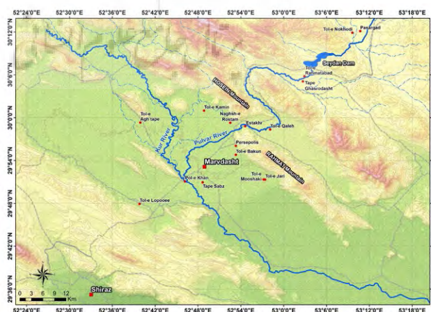
تصویر ۴: موقعیت محوطه تخت‌جمشید در دشت مرو دشت و رودخانه‌های کر و پلوار به‌عنوان دو منبع اصلی تأمین آب اراضی کشاورزی در دشت‌های منطقه

با وجود این ظرفیت‌ها و اهمیت‌ها، منطقه مرو دشت در سال‌های اخیر با مجموعه‌ای از چالش‌های فزاینده مرتبط با تغییرات آب‌وهوایی مواجه شده است. کاهش بارندگی، تداوم دوره‌های خشکسالی، افت منابع آب سطحی و زیرزمینی، گسترش فرایندهای بیابان‌زایی و افزایش فراوانی و شدت رخدادهای حدی آب‌وهوایی از جمله سیلاب‌ها و نوسانات دمایی، از مهم‌ترین پیامدهایی هستند که پایداری اکولوژیک منطقه را تحت‌تأثیر قرار داده‌اند. برداشت فراتر از ظرفیت طبیعی از منابع آب زیرزمینی، به‌ویژه در محدوده تخت‌جمشید، در کنار ویژگی‌های زمین‌شناسی رسوبات و شرایط تکتونیکی منطقه، به بروز پدیده فرورانش در دشت مرو دشت و شکل‌گیری شکاف‌ها و ترک‌هایی با الگوی گسل‌مانند در پیرامون محوطه انجامیده است؛ روندی که یکپارچگی و پایداری این مجموعه ارزشمند تاریخی را با مخاطره مواجه می‌سازد (Naderi, Raeisi, and Talebian 2014؛ رئیسی اردکانی ۱۳۸۹، ۱۷۹-۱۸۱). این تحولات نه تنها تاب‌آوری و معیشت جوامع محلی وابسته به کشاورزی را با تهدید مواجه کرده‌اند، بلکه به‌طور مستقیم و غیرمستقیم پایداری محوطه‌های میراث‌فرهنگی، از جمله تخت‌جمشید، را نیز در معرض مخاطرات جدی قرار می‌دهند و ضرورت اتخاذ رویکردهای سازگاری و مدیریت یکپارچه را بیش از پیش برجسته می‌سازند.