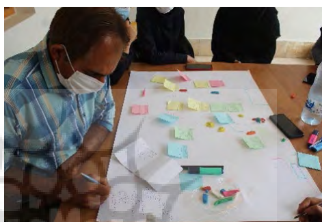
تصاویر ۷ تا ۱۰: حضور جامعه محلی در محوطه تخت جمشید و هم‌اندیشی درباره چالش‌های موجود

میراث‌فرهنگی، امنیت معیشتی و تاب‌آوری اجتماعی در منطقه تخت‌جمشید است. در کنار شناسایی تهدیدها، تمرکز بر ظرفیت‌ها و نقاط قوت جامعه محلی یکی از دستاوردهای مهم این برنامه بود. مشارکت‌کنندگان فعالیت‌های مرتبط با گردشگری، حضور نیروهای جوان و متخصص، دانش سنتی و مهارت‌های بومی در مدیریت بحران را به‌عنوان منابعی ارزشمند برای کاهش و مدیریت ریسک‌های اقلیمی معرفی کردند (جدول ۲). این یافته‌ها نشان می‌دهد که راهبردهای سازگاری زمانی اثربخش خواهند بود که بر ظرفیت‌های درون‌زا تکیه کرده و نقش فعال جامعه محلی را به رسمیت بشناسند.