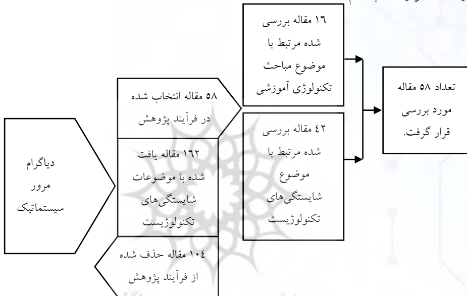
روند جستجو و انتخاب نظام مند مقاله‌ها

روش پژوهش کیفی بود که از تحلیل محتوای کیفی از نوع استقرایی استفاده شد که روشی برای کاستن از داده‌ها و ایجاد معنا از آن‌ها است. واحدهای محتوا در طبقاتی مختلف و مرتبط طبقه‌بندی و هر واحد تحلیل در یک طبقه قرار گرفت یعنی کدگذاری انجام شد. واحد تحلیل مضمون بود چراکه واحد تحلیل می‌تواند یک واژه ساده تا کل یک پیام باشد (دلاور، ۱۳۹۶). البته در برخی موارد واحد تحلیل در صورت بیان صریح و آشکار مضامین، به صورت کلمه موردبررسی قرار گرفت. جهت تحلیل داده‌های کیفی از روش کدگذاری استفاده شد. در تحلیل داده‌ها کدگذاری صورت گرفت و مؤلفه‌های فرعی و اصلی استخراج گردید. میدان تحقیق (جامعه آماری) این پژوهش بر مبنای نظریه‌های، اسناد موجود در پایگاه‌های مرتبط، کتب و