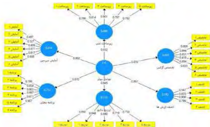
شکل ۲: مدل ساختاری پژوهش