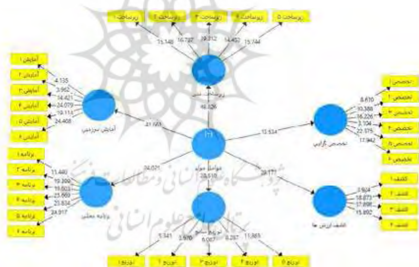
شکل ۳: ضرایب تی مدل

برای بررسی برازش مدل ساختاری پژوهش از چندین معیار استفاده می شود که اولین و اساسی ترین معیار، ضرایب معنی داری t یا همان مقادیر t -values می باشد. در صورتی که مقدار این اعداد از 0/95 بیشتر شود، نشان از صحت رابطه بین متغیرها و در نتیجه تأیید روابط در سطح اطمینان 1/96 دارد. با توجه به نتایج مدل تحقیق مشخص گردید که تمامی عوامل حضور معناداری در مدل تحقیق دارند. جدول ۵، نتایج مربوط به شاخص های برازش مدل فوق را نشان می دهد: