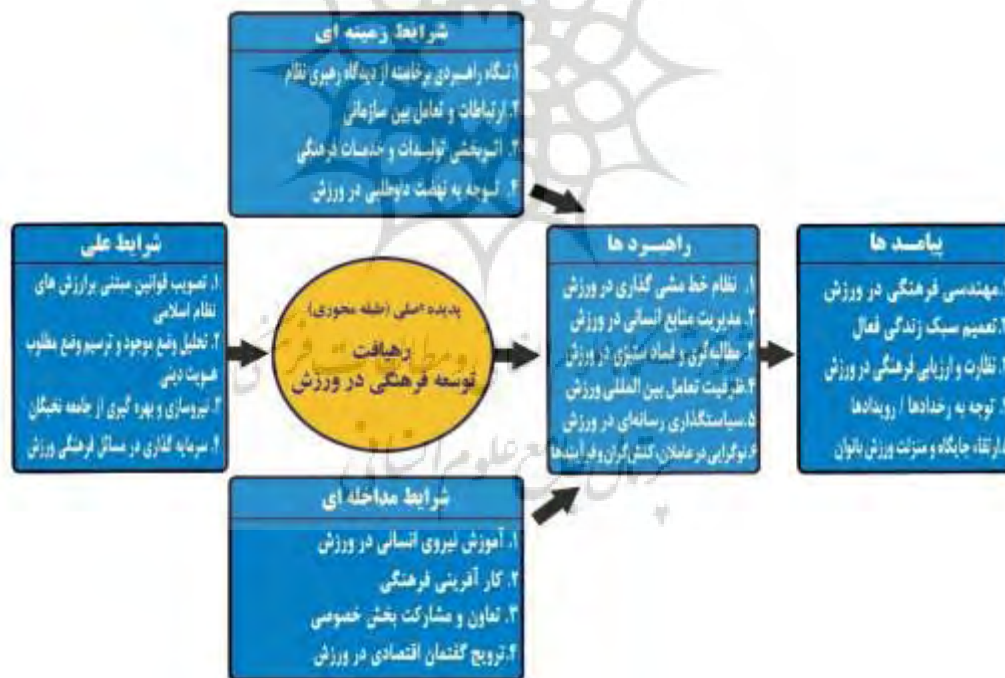
شکل ۱- الگوی پارادایمی رهیافت توسعه فرهنگی در ورزش

در شکل (۱) الگوی کدگذاری (مدل پارادایمیک) نظریه داده‌بنیاد برای رهیافت توسعه فرهنگی در ورزش ارائه شده است که نتیجه فرایند کدگذاری انتخابی و نظریه‌پردازی مفاهیم و مقولات برآمده از گردآوری اطلاعات تحقیق حاضر است. این نظریه مکانیسمی را نشان می‌دهد که به‌وسیله آن نهادهای دولتی و غیردولتی سازوکار سیاست‌های توسعه فرهنگی در ورزش کشور را بشناسند و در جهت اعتلا و ارتقای آن تلاش و کوشش کنند.