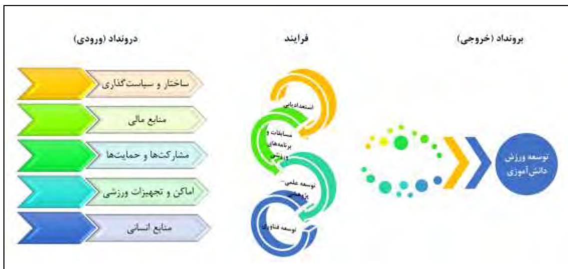
شکل ۳- مدل نهایی توسعه ورزش مدارس