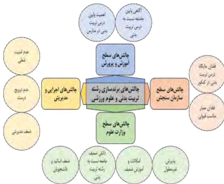
شکل ۱. مدل چالش‌های برندسازی رشته تربیت‌بدنی و علوم ورزشی