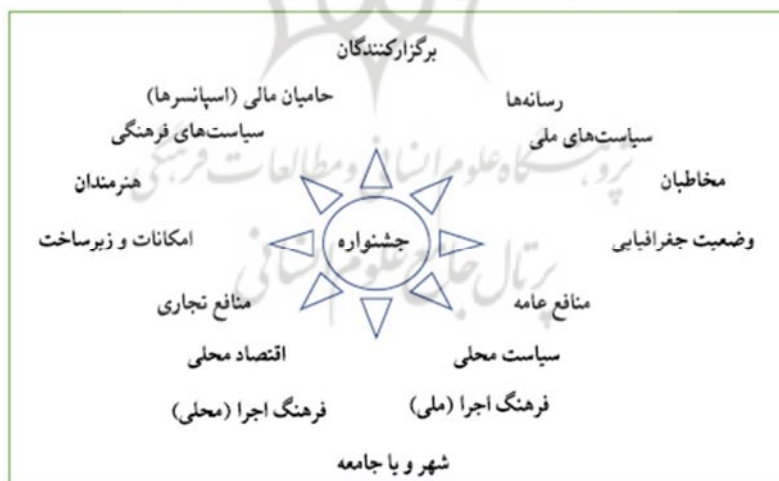
شکل ۱. عوامل موثر در برگزاری جشنواره فرهنگی-هنری

با ورود به دوران مدرن، معنا و برداشت از جشنواره تنها محدود به مفهوم مذهبی آن نیست. امروزه، طیف وسیعی از جشنواره‌های تجاری و هنری وجود دارند که هر کدام اهداف متفاوتی را دنبال می‌کنند. برای یک فیلم‌ساز، کلید موفقیت در معرض دید قرار گرفتن است. چیزی که یک فیلم‌ساز در جشنواره فیلم به دنبال آن است، شهرت، پوشش مطبوعاتی، جوایز، فرصت برقراری تماس، دیدن فیلم‌اش توسط توزیع‌کنندگان و توزیع ایمن فیلم است (Ehrich, et al., 2022). در برگزاری یک جشنواره عوامل متعددی دخیل هستند. در مطالعه هاپلیچ (۲۰۰۷) این عوامل به صورت شکل ۱ اشاره شده است.