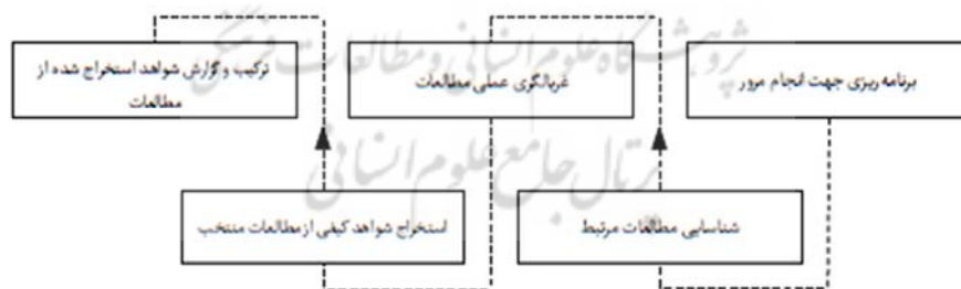
شکل ۲. مراحل روش مرور نظام‌مند ادبیات

پژوهش حاضر در زمره پژوهش‌های کیفی است. به‌منظور شناسایی و استخراج چالش‌های ارتقاء مرجعیت فیلم‌های جشنواره‌ای ایرانی از طریق مرور نظام‌مند ادبیات (Systematic Literature Review (SLR)، منابع مناسب پالایش و انتخاب شده‌اند. شکل (۱)، پروتکل انجام پژوهش را نشان داده‌است. بعد از تعیین سوال اصلی پژوهش، فعالیت‌های انجام مرور ادبیات، برنامه‌ریزی جهت انجام مرور پژوهشی، غربالگری علمی مقالات پژوهشی، ترکیب و گزارش شواهد استخراج شده از مقالات، استخراج شواهد کیفی از مقالات منتخب و شناسایی مقالات مرتبط.