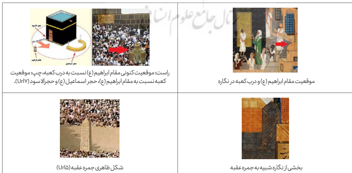
جدول ۳: مقایسه وضع کنونی بیت‌الحرام با امکانه موجود در نگاره پناه بردن مجنون به کعبه (طرح جدول از نگارندگان)

بر روی کتیبه روبرویی پرده خانه خدا عبارتی از تسبیح موسوم به «تسبیح تراویح» ۱۳ دیده می‌شود که با متن موجود این تسبیح اندکی تفاوت دارد و از این قرار است: شُبْحَانَ ذِي الْمُلْكِ وَالْمَلَكُوتِ * شُبْحَانَ الْمَلِكِ الْحَيِّ الَّذِي لَا يَمُوتُ. به نظر می‌رسد که بخش جنبی کتیبه پرده کعبه در سمت چپ نگاره نیز شامل عبارت: شُبْحَانَ ذِي الْعِزَّةِ باشد. این تسبیح در میان اهل سنت رواج دارد. ۱۴ در قسمت پایینی کتیبه روبرویی بر روی پرده خانه خدا حدیثی از پیامبر اکرم (ﷺ) آمده‌است: «عَجَّلُوا بِالصَّلَاةِ قَبْلَ الْفُوتِ». ۱۵ در بخش بالای در کعبه نیز حدیثی مروی از حضرت رسول اکرم (ﷺ) آمده‌است: «الصَّلَاةُ عِمَادُ الدِّينِ»: نماز ستون دین است. ۱۶ هم‌چنین در قسمت پایین نگاره در این نگاره یک کتیبه تک‌بیتی دیده می‌شود که از بخش ۱۶ «لیلی و مجنون» خمسه نظامی، داستان «بردن پدر، مجنون را به خانه کعبه» انتخاب و با قلم بسیار نازکی شبیه به قلم ریز خوشنویسی، و با عدم مهارت کافی تحریر شده‌است: از جای