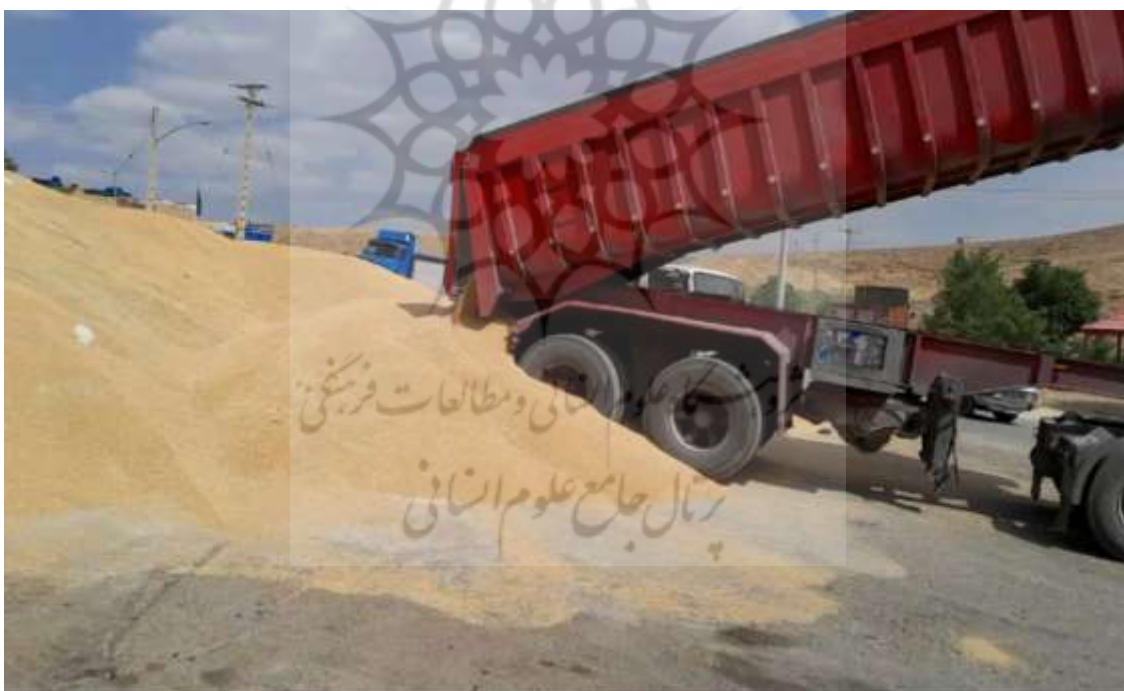
شکل (۴) برداشت و دپوی گندم در عشایر ایمان‌لو

در بیشتر مناطق، میانگین برداشت گندم دو تُن در هر هکتار بوده، اما در این منطقه، میانگین