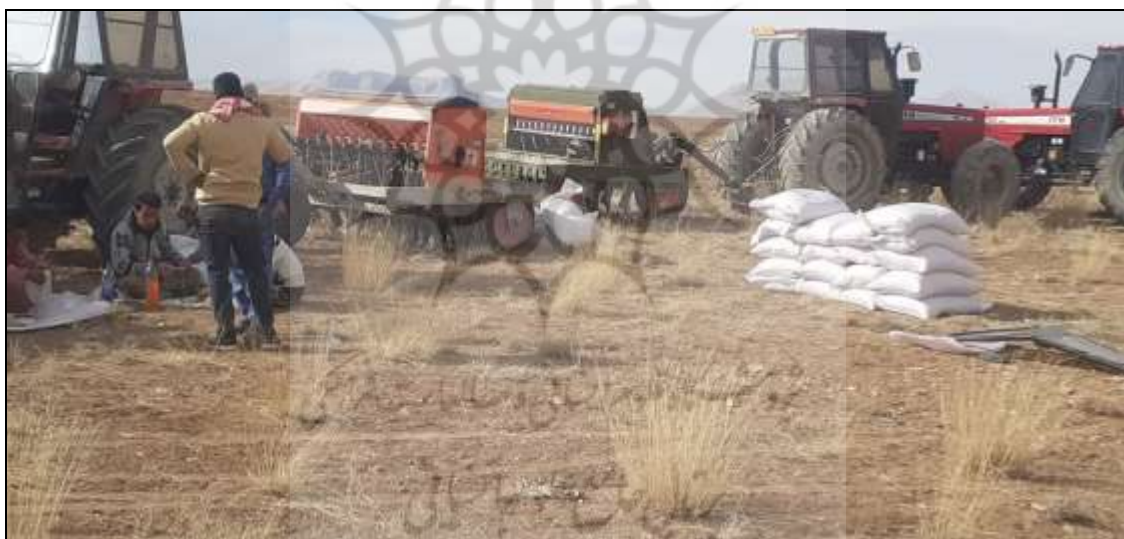
شکل (۳) همیاری در بین عشایر ایمان‌لو در کشاورزی

به عنوان نمونه، سه برادر که در سه خانواده زیستی جداگانه هستند، اما در یک سکونتگاه زندگی می‌کنند، در مدیریت امر تحصیل فرزندان، کشاورزی و دامداری، به‌اختیار و به‌صورت منعطف تفکیک وظیفه می‌نمایند (شکل ۳): به‌نحوی که سرپرست یکی از خانواده‌های زیستی (برادر الف) مسئولیت احشام، چرا و کوچ سه خانواده را به عهده می‌گیرد. برادر (ب) نیز در عین همکاری در امور کشاورزی و دامداری به‌طور خاص سرپرست فرزندان دانش‌آموز هر سه خانواده شده و در منزلگاه بیلاقی می‌مانند و برادر (ج) هم امور کشاورزی و تأمین علوفه را بر عهده می‌گیرد و پس