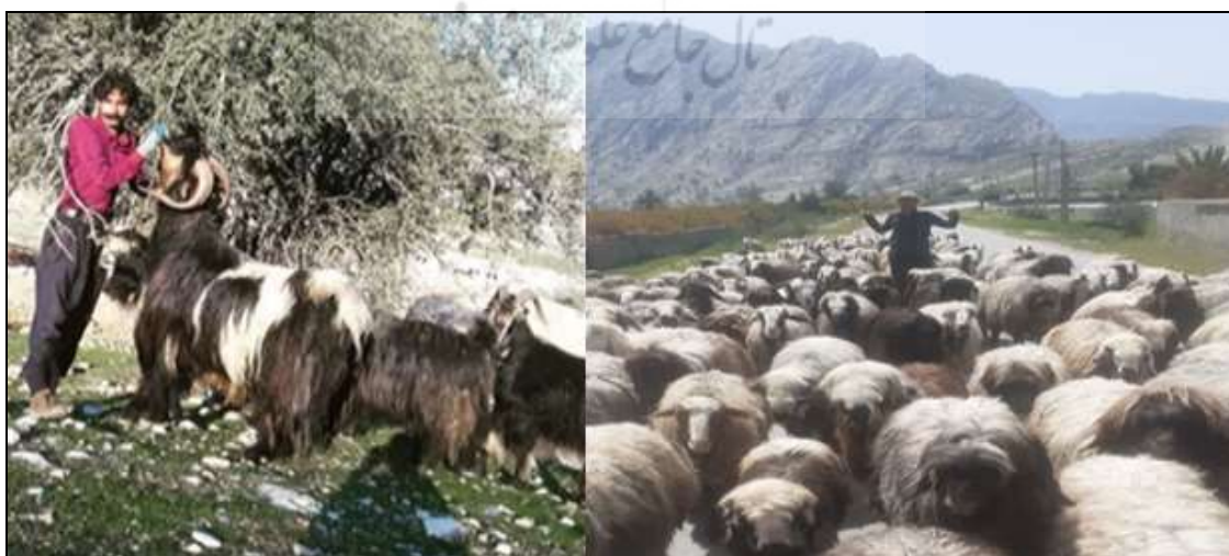
شکل (۵) دامداری در عشایر ایمان‌لو

عشایر ایمان‌لو در پرورش دام تخصص دارند و از موهبت طبیعی مراتع مطلوب منطقه چشمه‌رحمان به خوبی بهره می‌گیرند. عمده دامداری این گروه، پرورش گوسفند است و به لحاظ نژاد دامی، دام این منطقه جز نژادهای مطلوب شناخته شده است. نژاد بز ایمان‌لو از نژادهای شهره در ایل بختیاری و قشقایی است و نژاد آن در حال تکثیر است، اما گوسفندها اغلب از نژاد ترکی و بختیاری هستند و