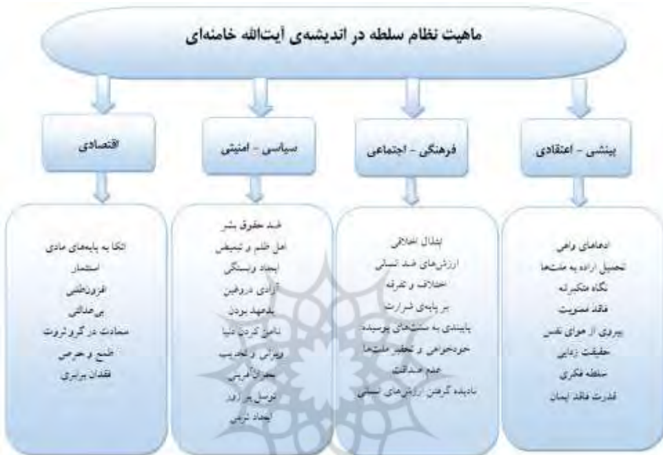
شکل ۱: مدل محقق ساخته پیرامون ماهیت نظام سلطه در اندیشه آیت‌الله خامنه‌ای

در این بخش، ضمن ارائه شبکه مضامین ماهیت نظام سلطه در هندسه فکری آیت‌الله خامنه‌ای، کدهای مستخرج از متون ایشان مورد بررسی قرار خواهند گرفت.