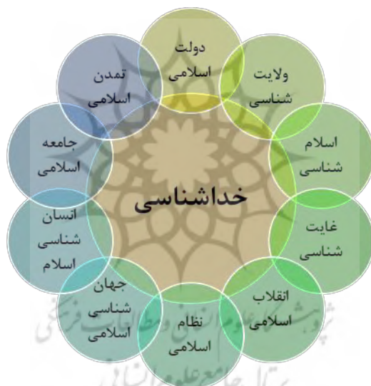
شکل ۲: شاکله‌ها و مبانی فکری و اندیشه‌ی سیاسی - اجتماعی رهبران انقلاب (محمودی‌رجا،

الهی تغییر دهد؛ بنابراین، شالوده‌های اثرگذاری نظام اندیشه‌ای آیت‌الله خامنه‌ای را می‌توان در پنج محور اصلی خلاصه کرد: جهان‌بینی توحیدی به‌عنوان زیرساخت معنایی همه نظامات سیاسی؛ الگوی حکمرانی امام - امت به‌عنوان پیوند ارگانیک رهبری و مردم؛ قرائت جامع و عقلانی از اسلام سیاسی؛ راهبرد تمدنی برای تحقق تمدن نوین اسلامی؛ و ارتقای مردم‌سالاری دینی به‌مثابه الگویی راهبردی و اثربخش در سطح منطقه و عرصه بین‌الملل. این دستگاه فکری، نه فقط تبیین‌گر و نظریه‌پرداز، بلکه کنشگر فعال در میدان‌های واقعی سیاست و فرهنگ جهانی است و این پیوند نظر و عمل، راز ماندگاری و کارآمدی آن به‌شمار می‌آید. مهم‌ترین مؤلفه‌های تأثیرگذار بر تفکر و کنش آیت‌الله خامنه‌ای در شکل زیر نشان داده شده است: