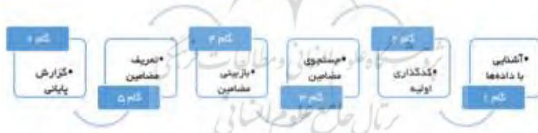
شکل ۱: مراحل انجام تحقیق مبتنی بر تحلیل مضمون (کلارک و براون، ۲۰۱۳)

ذهنیت جوانان غرب نقش داشته است. تحلیل داده‌ها با روش تحلیل مضمون (Thematic Analysis) در چارچوب «شبکه مضامین» انجام گرفت: کدگذاری اولیه بر اساس گزاره‌های کلیدی مرتبط با عدالت‌خواهی جهانی، نقد ساختار رسانه‌ای غرب، احیای هویت اسلامی و بازتعریف نسبت اسلام و غرب؛ خوشه‌بندی کدها در «مضامین پایه»؛ ادغام آن‌ها در «مضامین سازمان‌دهنده»؛ و استخراج «مضمون فراگیر»: «راهبردهای دیپلماسی عمومی و گفتمان‌سازی تمدنی در مواجهه با نظم رسانه‌ای-سرمایه‌دارانه غرب». از نظر چارچوب تحلیلی، رهیافت هرمنوتیکی کوئینتن اسکینر به کار گرفته شد که نامه‌ها را به‌مثابه کنش‌های گفتاری در بافت تاریخی، سیاسی و رسانه‌ای تحلیل می‌کند. این رویکرد امکان شناسایی نیت گفتمانی، موقعیت گفتار و کارکرد ارتباطی را فراهم کرده و با کشف پیام‌های آشکار و ضمنی، لایه‌های معنایی پنهان و منطقی ارتباطی با مخاطب خاص یعنی جوانان غرب، مطالعه را از سطح توصیف فراتر برده و به استخراج بنیان‌های معنایی، منطق استراتژیک و ظرفیت‌های تمدنی منجر می‌شود. یافته‌ها بدین‌سان چارچوبی برای فهم نقش دیپلماسی عمومی در بازتعریف هویت و تصویر جهان اسلام و شکستن انحصار روایی نظم رسانه‌ای غرب ارائه می‌دهند. فرآیند تحلیل داده‌های متنی در روش تحلیل مضمون در شکل زیر آورده شده است: