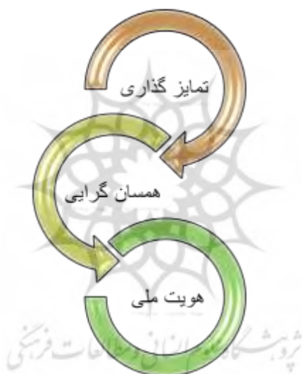
شکل ۲: سازه‌های مفهومی هویت ملی

سازه‌های مفهومی هویت ملی نیز از عناوین مهم در طرح مفهومی هویت ملی است که شامل تمایز گذاری با عناصر غیر هویتی و همسان گرایی با عناصر خود هویتی است