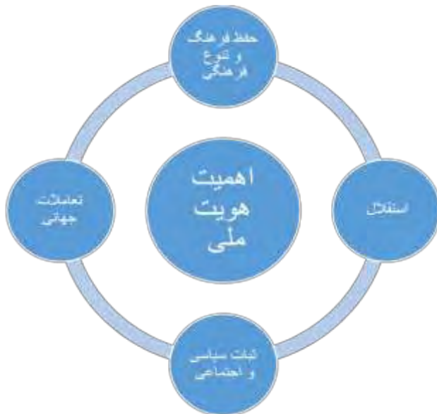
شکل ۱: اهمیت هویت ملی

ابعاد هویت ایرانی از مناظر گوناگونی مورد بررسی قرار داده شده است؛ که ترسیم ابعاد هفت‌گانه در عبارات زیر یکی از آن تقسیم‌بندی‌ها است: ۱- بعد اجتماعی ۲- بعد تاریخی ۳- بعد جغرافیایی ۴- بعد سیاسی ۵- بعد دینی ۶- بعد فرهنگی ۷- بعد زبانی و ادبی (حاجیان، ۱۳۷۹: ۱۹۳).