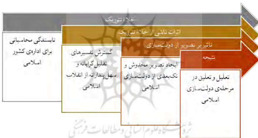
شکل ۱: رابطه پیش‌فرض پژوهش با مسئله پژوهش

هدف پژوهش، ارائه خوانشی ضد استعماری از «نقشه راه انقلاب اسلامی» برای نجات تصویر دولت‌سازی از تنگنای تفسیرهای تقلیل‌گرایانه و سهل‌پندارانه است. مدعا این است که: آیت‌الله خامنه‌ای در تدابیر مرحله دولت‌سازی اسلامی، به پی‌ریزی الگویی بدیل برای اداره استعماری جهان توجه ویژه داشته‌اند؛ لذا در تحول منش و روش کارگزاران و اصلاح ساختارها و نظامات ملی به جوانب بین‌المللی دولت‌سازی تذکر داده‌اند تا در مجموع، حاکمیت اسلامی بتواند نقش مؤثر و تعیین‌کننده‌ای در گذار به «نظم جدید» ایفا نماید.