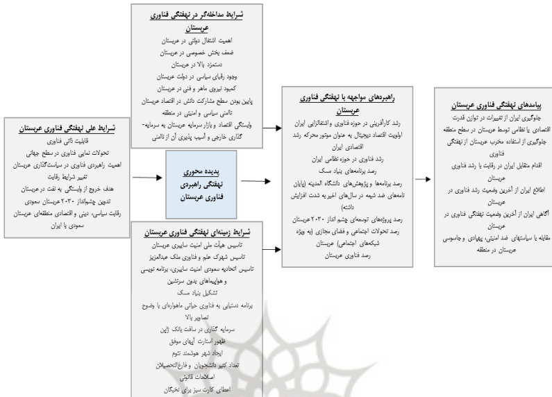
شکل ۴: الگوی آینده‌نگاری راهبردی جهت مواجهه با نهفتگی فناوری عربستان سعودی با رویکرد نظریه داده‌بنیاد

شرایط زمینه‌ای و مداخله‌گر، راهبردها و پیامدها مشخص شد. شکل (۴)، الگوی فرایند کیفی پژوهش را نشان می‌دهد.