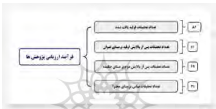
شکل ۲. فرآیند ارزیابی تحقیقات

در این مرحله از بین مقالات و پژوهش‌های در چند مرحله پالایش براساس عنوان پژوهش‌ها، بررسی چکیده و همچنین محتوای تحقیقات، تعداد ۳۷ مقاله به عنوان مقالات نهایی برای بهره‌برداری انتخاب شد.