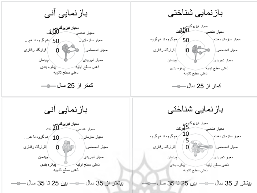
شکل ۵: فراوانی شاخص‌های بصری در سه بازه سنی و نحوه بازنمایی شناختی و آنی (نگارندگان)

نمونه پژوهش از لحاظ سن پاسخ‌دهندگان، شامل تعداد ۴۷ نفر کمتر از ۲۵ سال، ۷ نفر بین ۲۵-۳۵ سال و ۶ نفر بیشتر از ۳۵ سال می‌شود؛ بنابراین درصد تفکیک جامعه تقریباً ۷۸ درصد کمتر از ۲۵ سال و حدود ۱۱ درصد برای هر کدام از دو بازه سنی دیگر می‌شود. در شکل (۵) معیار انضمامی و ذهنی سطح ثانویه، بیشترین مقدار توجه افراد کمتر از ۲۵ سال در بازنمایی شناختی و آنی را داشته است. از طرفی در بازنمایی شناختی معیارهای تجریدی و سازمان‌دهنده، مقادیر تقریباً مشابهی را به خود اختصاص داده‌اند. این در حالی است که در بازنمایی آنی معیار سازمان‌دهنده از قدرت بیشتری برخوردار است. همچنین معیارهای فیزیولوژیکی و حرکت نیز در بازنمایی آنی، توجه بیشتری را به خود اختصاص داده‌اند. در شکل (۵)، بازنمایی شناختی با مقایسه افراد ۲۵-۳۵ سال و بیشتر از ۳۵ سال مشخص است که شباهت پاسخگویی وجود دارد؛ اما معیار تجریدی و سازمان‌دهنده برای گروه سنی بیشتر از ۳۵ سال مهم‌تر بوده است و معیار ذهنی سطح اولیه برای افراد ۲۵-۳۵ سال مورد توجه بیشتر بوده است. در بازنمایی آنی مقادیر بسیار به هم نزدیک هستند و تفاوت معناداری دیده نمی‌شود. تنها معیار ذهنی سطح ثانویه در دیدگاه افراد بیشتر از ۳۵ سال