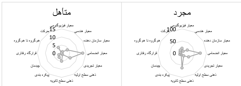
شکل ۳: فراوانی شاخص های بصری در دو گروه وضعیت تأهل و نحوه بازنمایی شاخصی (نگارندگان)

طبق شکل (۳) معیار انضمامی، بیشترین مقدار توجه افراد مجرد و متأهل را داشته است. همچنین معیارهای تجربی و سازمان دهنده، مقادیر تقریباً مشابهی را به خود اختصاص داده اند؛ اما معیار ذهنی سطح ثانویه که توسط نمونه مجرد به آن توجه ویژه ای شده بود و بسیار بالاتر از میانگین بود، در نمونه متأهل این میزان از میانگین بالاتر نرفته بود. از طرفی معیار حرکت که در نمونه مجرد مقدار پایینی داشت، در نمونه متأهل کمی بیشتر از میانگین را در بر گرفته بود.