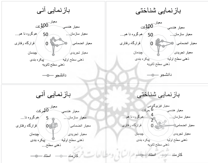
شکل ۷: فراوانی شاخص‌های بصری در سه گروه نوع تعامل با دانشگاه و نحوه بازنمایی شناختی و آنی (نگارندگان)

آنی وضعیت متفاوت است. در بازنمایی آنی بیشترین مقدار توجه افراد، به معیار ذهنی سطح ثانویه اختصاص دارد. سپس معیارهای سازمان‌دهنده و قرارگاه رفتاری هستند و در مرحله بعد معیارهای چیدمان، پیکره‌بندی، ذهنی سطح اولیه، تجربیدی، انضمامی و فیزیوگنومی قرار دارند. نکته قابل توجه در اینجا میزان گسترش اشاره به معیارهای بصری در بازنمایی آنی، نسبت به بازنمایی شناختی همین افراد است.