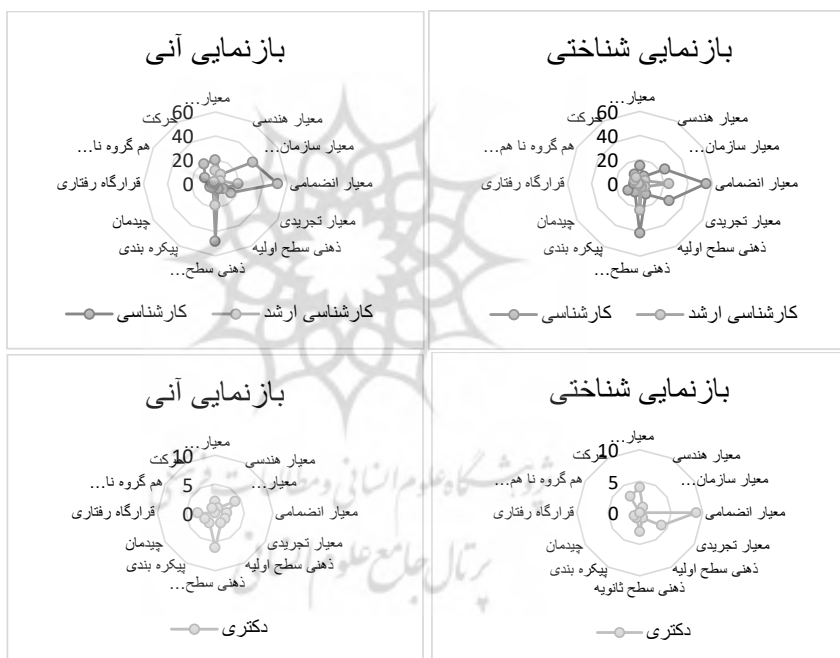
شکل ۶: فراوانی شاخص‌های بصری در سه گروه تحصیلات و نحوه بازنمایی شناختی و آنی (تکرارندگان)

نمونه پژوهش از لحاظ تحصیلات پاسخ‌دهندگان، شامل تعداد ۴۳ نفر کارشناسی، ۱۳ نفر کارشناسی ارشد و ۴ نفر دکتری می‌شود؛ بنابراین درصد تفکیک جامعه تقریباً ۷۱ درصد کارشناسی و حدود ۲۱ درصد کارشناسی ارشد و ۸ درصد دکتری می‌شود. در شکل (۶) معیار انضمامی و ذهنی سطح ثانویه، بیشترین مقدار توجه افراد کارشناسی در بازنمایی شناختی و آنی را داشته‌اند. از طرفی در بازنمایی شناختی، معیارهای تجربیدی و سازمان‌دهنده، مقادیر تقریباً مشابهی را به خود اختصاص داده‌اند. این در حالی است که در بازنمایی آنی معیار سازمان‌دهنده از قدرت بیشتری برخوردار است.