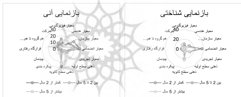
شکل ۸: فراوانی شاخص های بصری به سه گروه آشنایی با دانشگاه و بازنمایی شناختی و آنی (تکرارندگان)

نمونه پژوهش از لحاظ مدت آشنایی با محیط دانشگاه برای پاسخ دهندگان، شامل تعداد ۲۵ نفر کمتر از ۲ سال، ۱۹ نفر بین ۲ تا ۵ سال و ۱۶ نفر بیشتر از ۵ سال می شود؛ بنابراین درصد تفکیک جامعه تقریباً ۴۱ درصد کمتر از ۲ سال و حدود ۳۲ درصد ۲-۵ سال و ۲۷ درصد بیشتر از ۵ سال است.