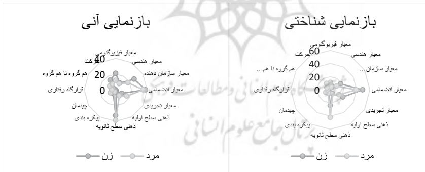
شکل ۲: فراوانی شاخص‌های بصری در دو گروه جنسیت و نحوه بازنمایی شناختی و آنی (نگارندگان)

نمونه این پژوهش ۶۰ نفر بود که شامل ۲۸ زن و ۳۲ مرد است. با توجه به این مقادیر، درصد تفکیک جامعه تقریباً ۵۰ درصد می‌شود. در شکل (۲)، فراوانی شاخص‌های بصری در دو گروه جنسیت و نحوه بازنمایی شناختی و آنی، آمده است. طبق شکل (۲) در بازنمایی شناختی، معیار انضمامی و ذهنی سطح ثانویه، بیشترین مقادیر را دارند. این در حالی است که تأثیر جنسیت بر این معیار به این صورت است که زنان بیشتر از مردان به معیار انضمامی در بازنمایی شناختی، توجه نشان داده‌اند. در خصوص تأثیر جنسیت بر معیار ذهنی سطح ثانویه می‌توان گفت که مردان بیشتر از زنان از این معیار، یاد کرده‌اند. در بازنمایی آنی نیز همین دو معیار بیشترین مقادیر را دارند، اما تأثیر جنسیت در بازنمایی آنی کم‌رنگ‌تر است و مقدار تقریباً مشابهی را به خود اختصاص داده‌اند. نکته قابل توجه دیگر این است که زنان در بازنمایی آنی به معیارهای فیزیوگنومی و پس‌از آن معیار سازمان‌دهنده، توجه نشان داده‌اند در حالی که در بازنمایی شناختی، این توجه شاخص نبوده است.