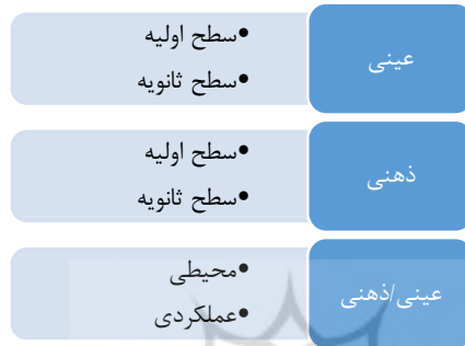
شکل ۱: تفکیک عوامل عینی، ذهنی و عینی-ذهنی و سطوح اولیه و ثانویه در آنان (نگارندگان)

عوامل عینی، ذهنی و عینی/ذهنی به تفکیک، بیان می‌گردند. همچنین گروه‌های عینی و ذهنی هرکدام به دو بخش سطوح اولیه و ثانویه، مجزا خواهند شد که در شکل (۱) عوامل عینی سطح اولیه به ویژگی‌های اولیه و ابتدایی محیط اشاره دارند. از این رو می‌توان آن‌ها را در سه گروه شامل معیارهای فیزیوگنومی، هندسی و سازمان‌دهنده تقسیم‌بندی کرد (Ma et al., 2023a). در ادامه هر یک شرح داده می‌شوند.