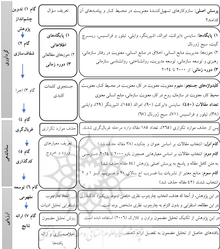
شکل ۱: مراحل گردآوری، مرتب‌سازی و ارزیابی منابع در فرآیند مرور نظام‌مند

همان‌گونه که در شکل (۱) دیده می‌شود در نتیجه فرایند غربال‌گری مقالات، تعداد ۵۱ مقاله از معیارهای لازم برای ورود به فرایند تحلیل، برخوردار بودند. فهرست مشخصات این مقالات به همراه شناسه اختصاص‌یافته به هر یک از آنها در جدول (۳) ارائه شده است.