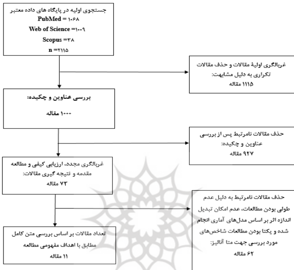
شکل ۱: فرآیند استخراج مقالات بر اساس فلوجارت PRISMA

برآورد اندازه اثر و واریانس با استفاده از پکیج "metafor" و "robumeta" در RStudio (2024.12.1+563) محاسبه شد. در اینجا از برآورد واریانس قوی (RVE) برای تعیین اندازه اثر استفاده شد. برآورد واریانس و ناهمگنی بین مطالعاتی با استفاده از مدل های اثرات تصادفی برازش شده با استفاده از تابع "robu" در بسته "robumeta" به دست آمد. نمودار جنگل برای نمایش بصری داده استفاده شد. از متا رگرسیون برای بررسی خصوصیات اطلاعات پایه ای بر روی اندازه اثر کلی استفاده شد. در تحلیل حساسیت، نتایج مجدد با انتخاب همبستگی ای مختلف بررسی شد ( \rho = 0.1, \rho = 0.2, \rho = 0.4, \rho = 0.6, \rho = 0.8, \rho = 1 ).