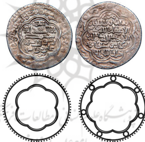
شکل ۲. سکه‌ی اولجایتو ایلخانی (zeno, n.d)

نقش هندسی دایره‌ی دو خطی در مرکز - خط دایره‌ی دور سکه و خط با نقطه چین دور آن و یک شکل خطی اسپیرال دوطرفه که در وسط شکل قلب را ایجاد کرده است.