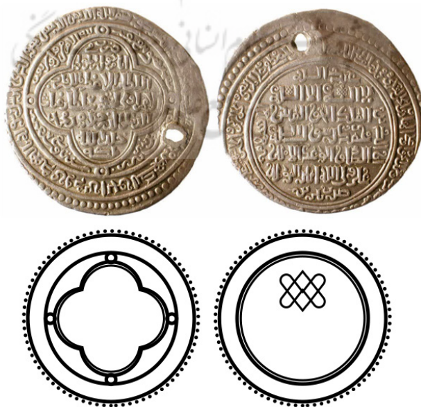
شکل ۱. سکه‌ی اولجایتو ایلخانی (sahebdivan,n.d)

سکه‌های ایلخانی مجموعه‌ای از سکه‌های تاریخی گوناگون‌اند که در دوران استیلای ایلخانان مغول بر فلات ایران ضرب شده‌اند و شامل انواع طلا، نقره و مس می‌شوند نمونه‌های حاضر از سکه‌های نایاب دوره‌ی اولجایتو هستند که در تبریز ضرب شده‌اند.