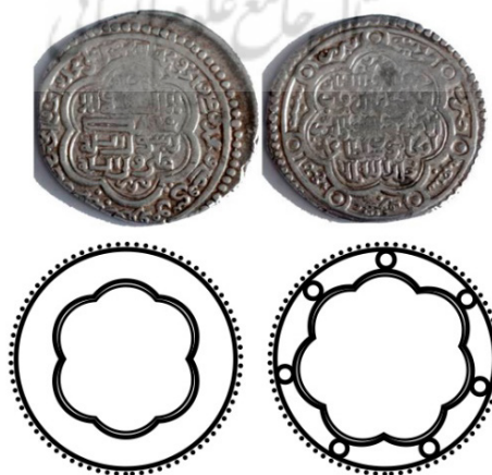
شکل ۵. سکه اولجایتو ایلخانی (zeno, n.d)

نقش هندسی دایره دو خطی در مرکز - خط دایره دور سکه و خط و قرار گیره دو شکل خطی در هم تنده به شکل دو قلب درهم تنده و چسبیده به تنه ی حرف الله و یک شکل خطی اسپیرال دوطرفه که در وسط شکل قلب را ایجاد کرده است.