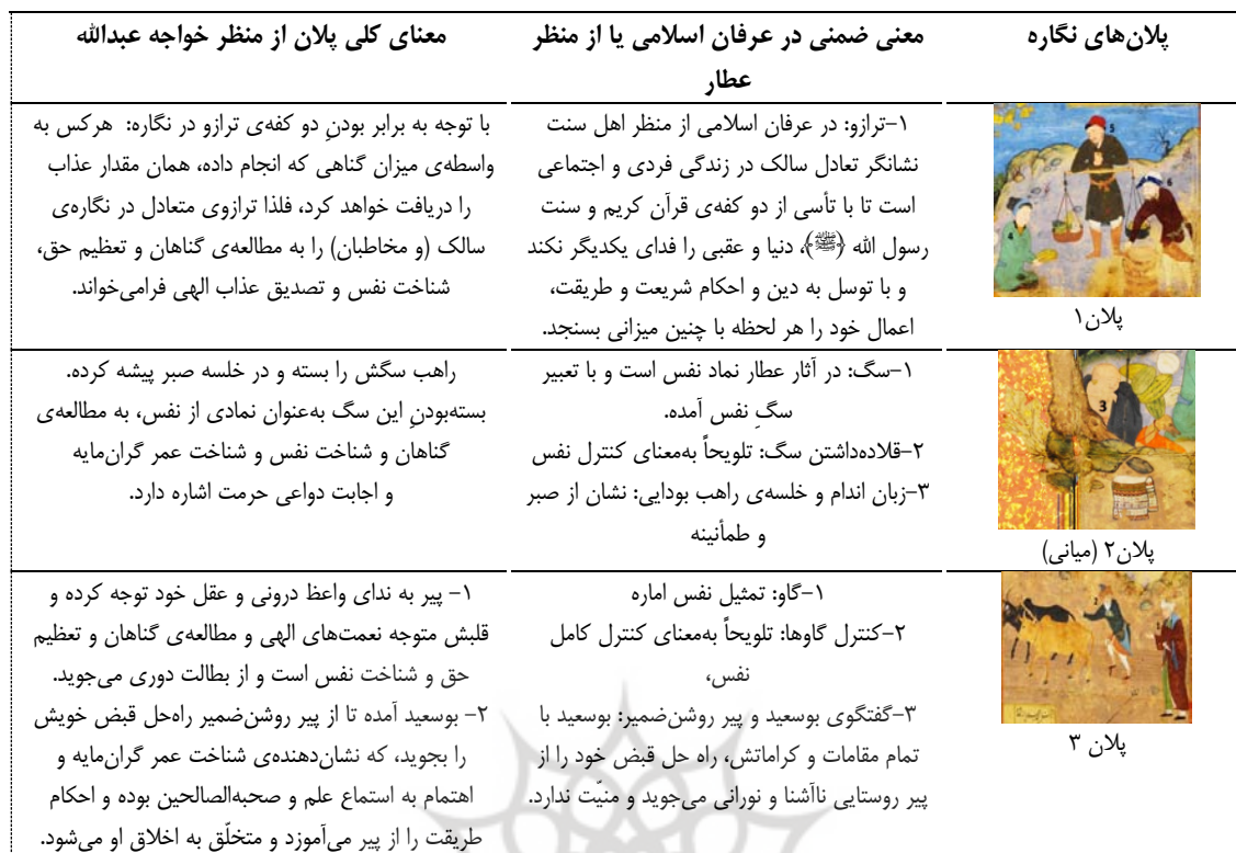
جدول ۳: جزئیات کلیدی نگاره و معانی ضمنی آن‌ها از منظر عرفان اسلامی و تطبیق با آراء خواجه عبدالله انصاری Table 3: Key Details of the Illustration and Their Implicit Meanings from the Perspective of Islamic Mysticism in Comparison with the Views of Khwaja Abdullah Ansari

سهم کاتب: سلطانعلی در این نگاره نیز به دلیل موضوع خاص آن که در فضای باز و زمین زراعی رخ داده است، به دو کتیبه‌ی فوقانی و تحتانی نستعلیق از اشعار عطار اکتفا کرده است، اما سخنان پیر روشن‌ضمیر در ابیات ناتمام می‌ماند و مخاطب برای درک کامل داستان باید به منطلق الطیر مراجعه کند. از فحوای اشعار نوشته‌شده نیز مطلبی دال بر ارتباط با شئون نه‌گانه‌ی یقظه یافت نمی‌شود.