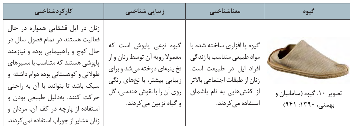
جدول ۹. تحلیل انسان‌شناختی گیوه زنان ایل قشقایی

یکی از موارد بسیار مهم و تأثیرگذار بر پوشاک مردمان این منطقه، که بر اساس باورها و اعتقادات آنها شکل گرفته است، انتخاب رنگ پوشاک است. رنگ در پوشاک زنان با توجه به مؤلفه‌های اجتماعی همچون سن و جنس از تنوع زیادی برخوردار است. کودکان و دختران نوجوان قشقایی از رنگ‌های شادی چون صورتی، قرمز، سفید، آبی روشن و... استفاده می‌کنند و نوجوانان از رنگ‌های متنوع‌تری مانند زرد و سفید، سفید و صورتی و قرمز در پوشاک استفاده می‌کنند. دلیل امتیاز این رنگ‌ها بر سایر رنگ‌های دیگر (به‌خصوص رنگ سفید که نشانه سفیدبختی و خوشبختی فرد است) نشان‌دهنده تازه‌عروس بودن است. برای آن‌که لباس عروس از زیبایی بیشتری برخوردار باشد، رنگ زرد و سفید را با هم به کار می‌برند تا جلوه بیشتری داشته باشد. همچنین باور این قوم آن است که تازه‌عروس باید رنگ روشن بپوشد و رنگ تیره، باعث تیره‌بختی او می‌شود. تا حدود ده سال پس از ازدواج، از این رنگ‌ها استفاده می‌شود. اما پس از متولد شدن فرزندان و کار زیاد، فشار سختی‌ها و مسئولیت‌هایی