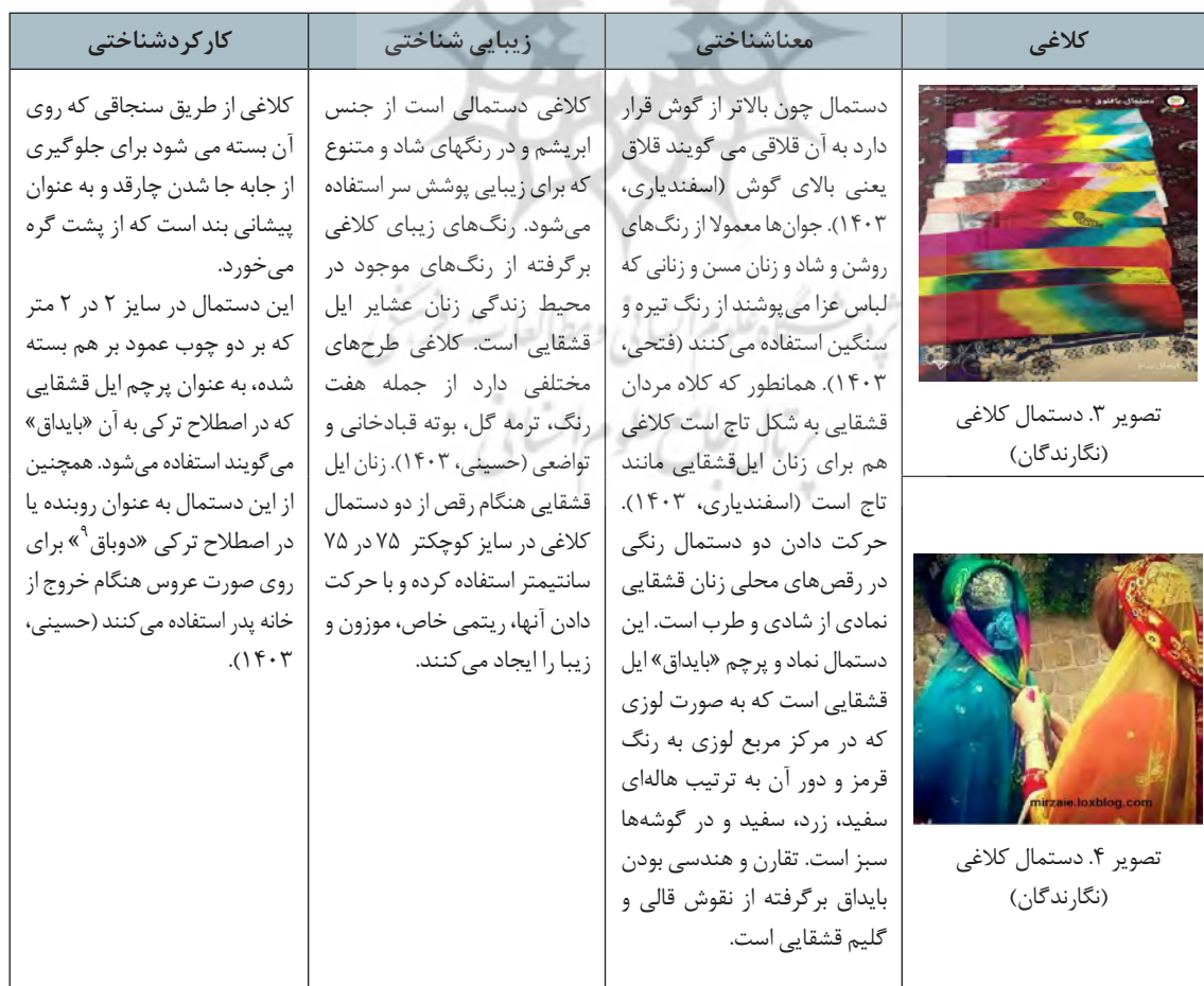
جدول ۳. تحلیل انسان شناختی کلاغی زنان ایل قشقایی