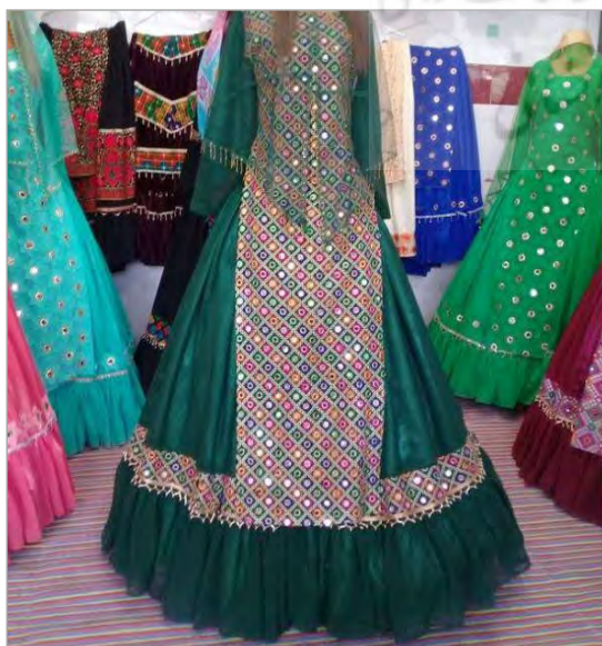
تصویر ۱۲. تزیینات پوشاک زنان ایل قشقایی (URL4)

کارکرد و تأثیر روانی رنگ‌ها در بررسی پوشاک و ویژگی‌های فرهنگی - اقلیمی را نیز نباید از نظر دور داشت. در بررسی رنگ‌های مربوط به پوشاک زنان قشقایی، استفاده از رنگ‌های تند، شاد، زنده و طبیعی، اولین چیزی است که نظر بیننده را جلب می‌کند. رنگ مورد استفاده پوشاک، چنانچه در پژوهش هم اشاره شد، گویای ویژگی‌های اجتماعی و فرهنگی هر قوم است. فرهنگ عامه، سرشار از نشانه‌ها و نمادهاست و نماد یکی از جنبه‌های بیانی رنگ است. نمادهای این خصیصه تا حدی تحت تأثیر خودآگاه انسان و تا حدی تحت تأثیر شرایط اقلیمی، اجتماعی، سیاسی و مذهبی جامعه، به شکلی