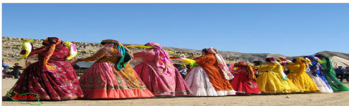
تصویر ۱۱. رنگ‌های پوشاک زنان قشقایی (قرخلو، ۱۳۸۲: ۱۳۵)

لباس زنان ایل معمولاً از جنس پارچه‌های ساده‌ای چون وال، گودری و چیت است و به دست خودشان دوخته می‌شود. افراد ثروتمند ایل هم از پارچه‌های گران قیمت مثل زربفت و