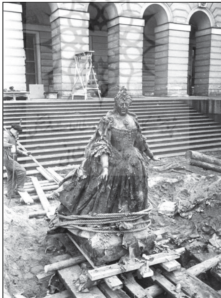
شکل ۱: نجات بخشی مجسمه کارلو بارتولومئو راسترلی با عنوان آنا ایوانوونا همراه با پسر بچه آفریقایی، ۱۹۴۵ م. (Ermakova, 2020). Fig. 1: Rescue of Carlo Bartolomeo Rastrelli's sculpture titled Anna Ivanovna with an African Boy, 1945 (Ermakova, 2020).

طبق تحقیقات «ارماکوا» (2020) با آغاز جنگ جهانی دوم بسیاری از موزه‌های بزرگ اروپا و روسیه برای نجات میراث فرهنگی بشر، عملیات گسترده‌ای برای تخلیه، پنهان‌سازی و حفاظت از آثار هنری به‌راه انداختند. در موزه آرمنیتاژ سن پترزبورگ، از همان روزهای نخست جنگ در ۱۹۴۱ م.، کارکنان شبانه‌روز به بسته‌بندی آثار پرداختند و بخش بزرگی از مجموعه در کاروان‌هایی به سوردلوفسک ۳ منتقل شد. تنها خسارت مهم این موزه، ناپدید شدن تابلوی سنت سباستین ۴ اثر «آنتونی فان دایک» ۵ بود. در کنار آن، در موزه روسیه مجسمه عظیم «آنا ایوانوونا با پسر بچه آفریقایی» ۶ (شکل ۱) در گودالی پنهان شد و تابلوهای بزرگ با دقت رول و منتقل شدند. هم‌چنین، گالری ترتیاکوف ۷ و موزه پوشکین ۸ در مسکو، آثار خود را به نووسیبیرسک فرستادند و حتی در سال‌های جنگ، نمایشگاه‌هایی از آن‌ها برگزار شد (Ermakova, 2020).