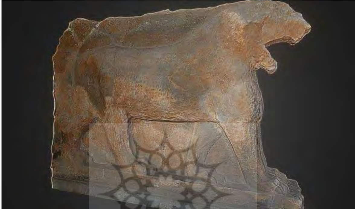
شکل ۲: تهیه تصویر سه بعدی شیر ایشتر با روی فتوگرامتری بر اساس تصاویر تهیه شده توسط بازدیدکنندگان پیش از تخریب اثر در موزه موصل (Vincent et al., 2015).

در نهادهای فرهنگی ۲۴ ، این فناوری‌ها کاربردهایی چون تضمین اصالت اسناد آرشیوی، مدیریت داده‌های کتابخانه‌ای، صدور مجوز استفاده و نمایش آثار دیجیتال در موزه‌ها و گالری‌ها داشته‌اند. در شرایط بحرانی هم‌چون جنگ، این قابلیت‌ها می‌توانند نقش حیاتی در جلوگیری از جعل، مستندسازی آثار در معرض تهدید، شفاف‌سازی فرآیند بازگرداندن آثار غارت‌شده و تسهیل تبادلات میان نهادها ایفاء کنند (Stublić et al., 2023).