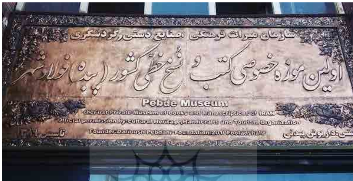
شکل ۱: سردر موزه نسخ خطی فولادشهر اصفهان (نگارندگان، ۱۴۰۴).

دیگر، تلاش شده است در این پژوهش به این پرسش محوری پاسخ داده شود که، چالش‌های حفاظت از نسخ خطی در شرایط نبرد میان ایران و رژیم اسرائیل کدام‌اند؟ ارزیابی این امر می‌تواند به ارائه راهبردهای سیاستی مؤثری در راستای حفظ این میراث و تحکیم بنیان‌های فرهنگ غنی اسلامی-ایرانی منجر شود.