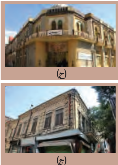
(شکل ۴).