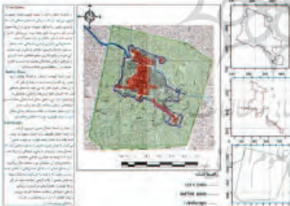
شکل ۳. حریم مجموعه میراث جهانی بازار تاریخی تبریز.

طول کلی راسته‌ها، دالان‌ها و تیمچه‌ها بالغ بر ۵۶۷۰ متر برآورد شده و سطح اشغالی در حدود ۲۷۶۰۰ مترمربع را به خود اختصاص داده‌اند. سرراها نیز با زیربنایی معادل ۲۳۵۰۰ مترمربع، نقشی بنیادین در ساختار فضایی و سلسله‌مراتب عملکردی بازار ایفا می‌نمایند. در این بافت متراکم تاریخی، بالغ بر ۶۰۰۰ باب دکان پراکنده‌اند و در مجموع، بیش از ۱۶۵ عنصر معماری متمایز شناسایی شده است؛ از جمله ۲۶ مسجد، ۲۴ سرا، ۱۶ راسته، ۱۴ دالان، ۲۰ تیمچه، ۵ حمام، یک یخچال و دو پل بازار (پایگاه میراث جهانی بازار تاریخی تبریز، ۱۳۹۴). پس از زلزله ویرانگر سال ۱۱۹۳ هجری قمری، تبریز بارویی تازه یافت و در جوار دروازه‌های آن، بازارچه‌هایی پدید آمد که نقش مهمی در تأمین نیازهای روزمره مردم محلات ایفا نمودند. این بازارچه‌ها، که به‌عنوان بخشی از ساختار سنتی شهر اسلامی به شمار می‌آمدند، علاوه‌بر محل دادوستد، بناهایی نظیر مسجد، حمام، قهوه‌خانه، زورخانه و کاروانسرا داشتند. برخی از این بازارچه‌ها به بازار اصلی شهر متصل شدند و برخی دیگر به صورت منفرد در قلب محله‌ها پابرجا ماندند. چنانکه امروزه نیز، این بازارچه‌ها با نام‌های تاریخی‌شان شناخته می‌شوند و بخشی از زندگی شهری تبریز را تشکیل می‌دهند. با وجود استراتژی‌ها و ضوابط سختگیرانه، توسعه شهری در حریم بازار، به ویژه پس از زمین‌لرزه سال ۱۱۹۳ هجری قمری، همچنان چالش‌های فراوانی در حفاظت از بافت تاریخی ایجاد کرده است (شکل ۳).