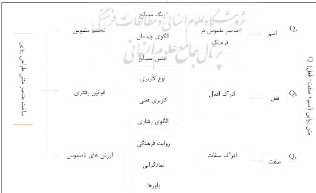
شکل ۲. مراحل ساختار متن روایی از ادراکات کالبد فضایی.