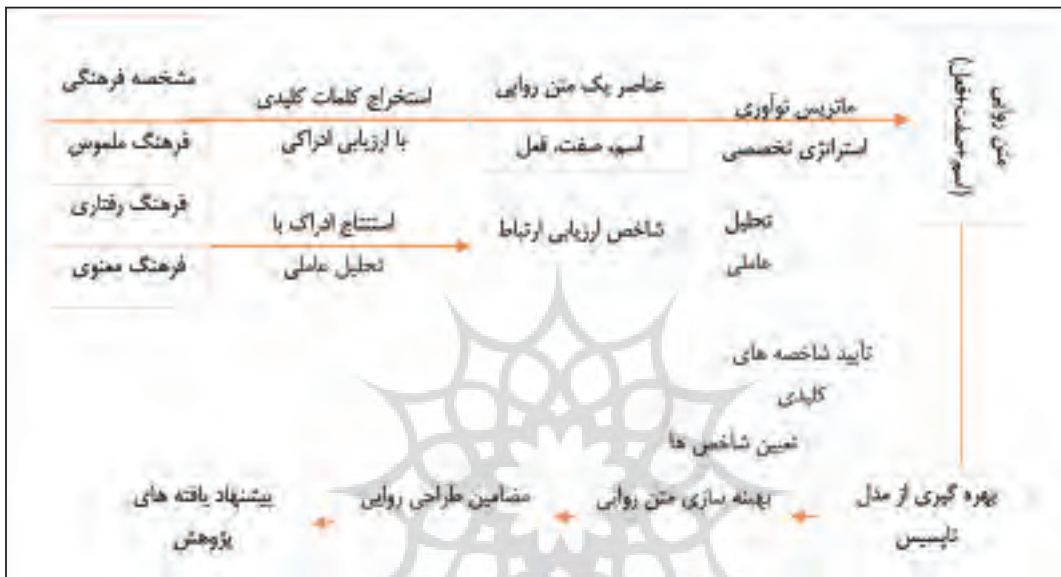
شکل ۱. فرآیند ساخت متن روایی میراث ناملموس (مأخذ: یافته‌های پژوهش).

در کنش‌های جمعی، به سه بعد روایت فرهنگی، نمادگرایی و باور تفکیک شد که لایه‌های مرتبط با ادراک صفات و ارزش‌های ناملموس را برجسته می‌سازند. این فرایند امکان تبدیل داده‌های کیفی به گویه‌های کمی و قابل سنجش را فراهم نمود و مبنای طراحی ابزار تحلیل کمی قرار گرفت. از سوی دیگر، انتزاع مختصرتر در متن روایی توان بازنمایی عناصر فرهنگی را تقویت می‌کند (Long, ۲۰۱۰). بدین صورت بر اساس رهیافت ساختارگرایی گریماس، روایت دارای دو سطح روایی ۱ و عمقی است که از خلال ساده‌سازی، امکان تبدیل پیچیدگی‌های فرهنگی به گفتمان‌های قابل فهم را فراهم