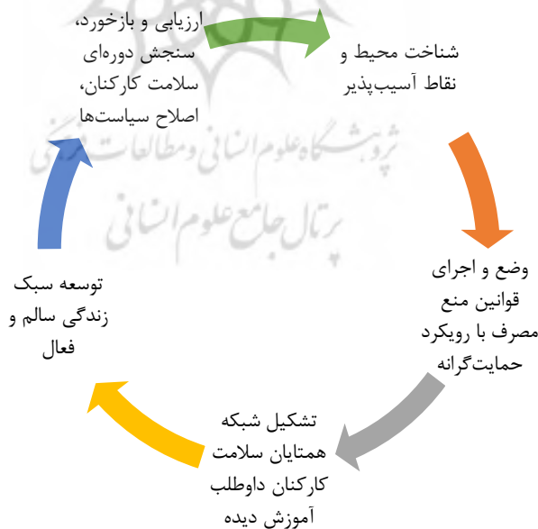
شکل ۳: مدل خلاقانه پیشنهادی این پژوهش برای ایجاد محیط کار سالم و به دور از مصرف مواد اعتیاد آور