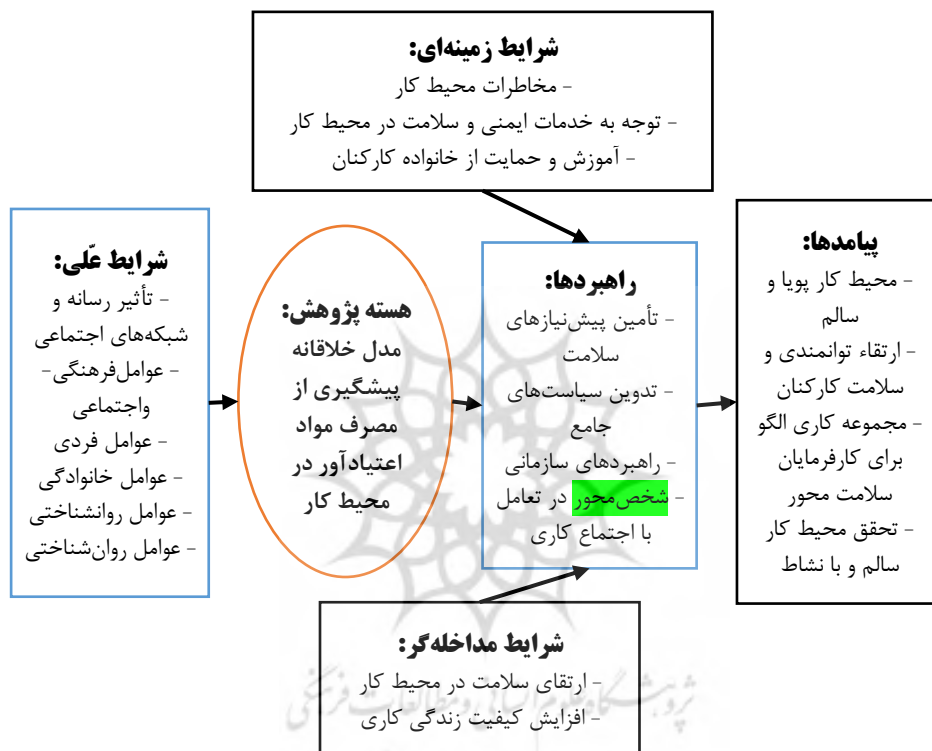
شکل ۲: مدل خلاقانه پیشگیری از مصرف مواد اعتیادآور در محیط کار برآمده از نظریه داده‌بنیاد

دسترسی به مشاوره) بستری را فراهم می‌کنند که راهبردها (سیاست‌های جامع و انعطاف‌پذیری سازمانی) بتوانند به پیامدهای مطلوب (بهره‌وری بالاتر و سلامت روانی کارکنان) منجر شوند و در نهایت مدل خلاقانه ارائه شده در شکل ۲ را در محیط کاری صنعتی تثبیت کنند.