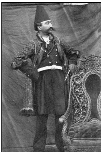
تصویر ۶: تفاخر به اثاثیه جدید؛ ناصرالدین شاه در کنار مبل اشرافی

و در جای دیگر با اشاره به یکی از تالارهای کاخ که به سبک اروپایی مبله شده بود، از هنرمندی سخن می‌گوید که با ضربات تند و آتشین پیانو می‌نواخت اما صدای بسیار آزاردهنده‌ای تولید می‌کرد؛ چراکه پیانوهایی که به ایران آورده بودند «چون در تهران کسی نبود که آن‌ها را کوک کند دیگر کسی کوکشان نکرده به همین دلیل صدای خارج از نت و نادرستی داشتند.» (همان، ۲۳۵) در توصیف کاخ عشرت‌آباد نیز می‌گوید به‌استثنای یک تالار بسیار زیبا که حال و هوای ایرانی دارد و از تزئیناتی با شیشه‌های کوچک هندی در آن استفاده شده، «اسباب و اثاث اروپایی سایر اتاق‌ها بسیار بازاری و عاری از سلیقه خوب است» (همان، ۱۹۹) او معتقد است «اهالی مشرق زمین بدون برخورداری از بصیرت لازم، یک نوع جنون خاصی دارند که اتاق‌های خود را به‌جای استفاده از ذوق هنری ملی کشورشان، با اشیا و آشغال‌های محصول اروپا تزئین نمایند.» (همان)