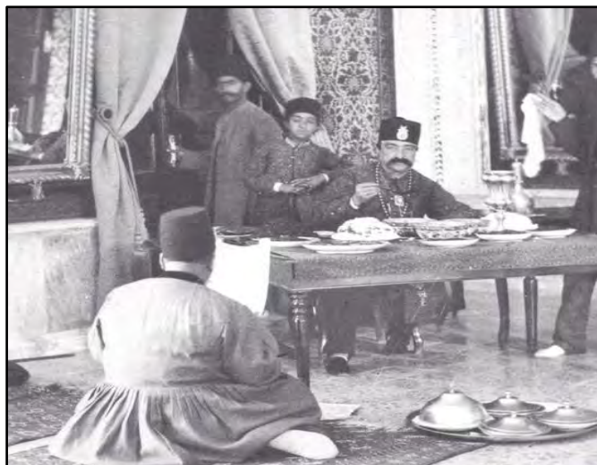
تصویر ۱۰. ناصرالدین شاه و میز ناهارش

با ورود میزها، صندلی‌ها و تختخواب‌های اروپایی (به عنوان عناصر مادی جدید) با ویژگی‌های فیزیکی خاص خود (حجم زیاد، وزن سنگین و ثابت بودن) دامنه کنش‌گری ساکنان محدود شد. برخلاف اثاثیه سنتی سبک و منعطف که به افراد امکان می‌داد فضا را بر اساس نیازهای لحظه‌ای بازتعریف کنند، این عناصر جدید با اشغال دائمی بخش‌هایی از فضا، قدرت عمل و خلاقیت ساکنان را کاهش دادند. در این فرآیند، به تدریج عناصر نمادین متحول شد و ارزش‌ها و هنجارهای فرهنگی خود را با عناصر مادی جدید تطبیق دادند. مفهوم «راحتی» از زمین‌نشینی به صندلی‌نشینی تغییر یافت، «حریم خصوصی» اهمیت بیشتری پیدا کرد، و «نظم ثابت» جایگزین «انعطاف‌پذیری» شد.