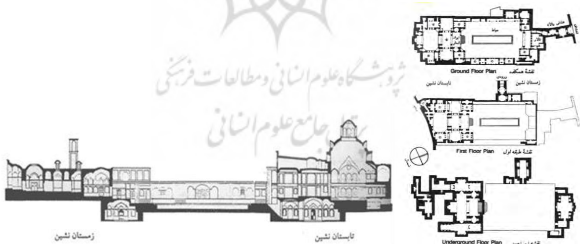
تصویر ۳. تفکیک بخش زمستان‌نشین و تابستان‌نشین در خانه بروجردی‌های کاشان؛ نمونه‌ای از تطبیق‌پذیری خانه سنتی با چرخه‌های زمان

تطبیق‌پذیری، انطباق فضاهای کالبدی یا عملکردهای متغیر فصلی و روزانه را شامل می‌شود. عامل زمان نیز نقش مهمی در خانه سنتی ایفا می‌کرده است. تطبیق‌پذیری و جابه‌جایی در بخش‌های مختلف خانه، بیش‌از هر چیز به عامل زمان و تغییر روز و شب و فصل‌های سال بستگی داشته است. برای مثال استفاده از بام خانه و بهارخواب در شب‌های تابستان، استفاده از ایوان‌های خانه در صبح یا عصر تابستان و یا استفاده از تالار تابستان‌نشین در ظهر تابستان، متناسب با تغییر زمان است.