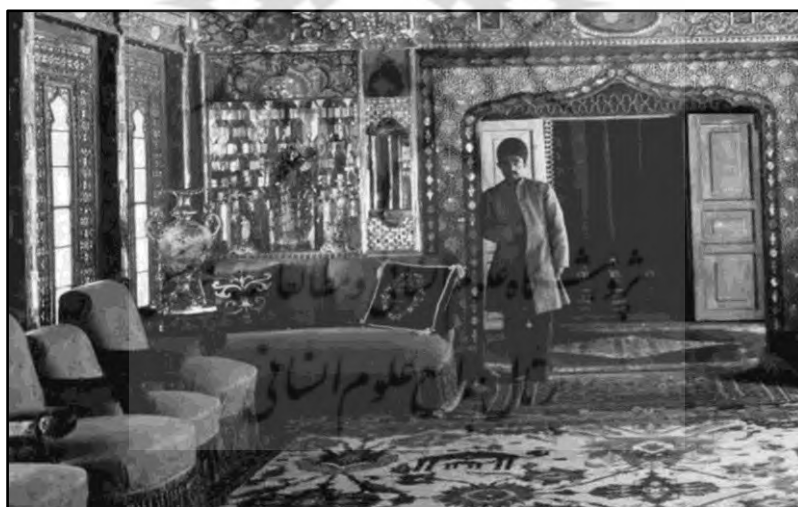
تصویر ۱۱. دکوراسیون داخلی خانه یکی از سیاستمداران اواخر دوره قاجار معروف به معاون الدوله

با ورود میزها، صندلی‌ها و تختخواب‌های اروپایی (به عنوان عناصر مادی جدید) با ویژگی‌های فیزیکی خاص خود (حجم زیاد، وزن سنگین و ثابت بودن) دامنه کنش‌گری ساکنان محدود شد. برخلاف اثاثیه سنتی سبک و منعطف که به افراد امکان می‌داد فضا را بر اساس نیازهای لحظه‌ای بازتعریف کنند، این عناصر جدید با اشغال دائمی بخش‌هایی از فضا، قدرت عمل و خلاقیت ساکنان را کاهش دادند. در این فرآیند، به تدریج عناصر نمادین متحول شد و ارزش‌ها و هنجارهای فرهنگی خود را با عناصر مادی جدید تطبیق دادند. مفهوم «راحتی» از زمین‌نشینی به صندلی‌نشینی تغییر یافت، «حریم خصوصی» اهمیت بیشتری پیدا کرد، و «نظم ثابت» جایگزین «انعطاف‌پذیری» شد.