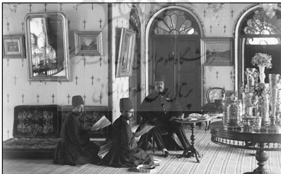
تصویر ۸. تصویری از میز و صندلی و اثاثیه غربی در کنار پشتی در دربار ناصرالدین شاه

با گذشت زمان و در چرخه بعدی تحول فضایی، شاهد شکل‌گیری نوعی دوگانگی رفتاری هستیم که در نظریه اشتورم به خوبی قابل تبیین است. در این مرحله ترکیب تازه‌ای از عناصر مادی و رفتار کنشگران حاصل می‌شود. عناصر مادی جدید به تدریج در فضاهای نیمه‌عمومی مانند اتاق‌های پذیرایی مهمانان جای خود را باز کردند، اما نتوانستند به حریم خصوصی‌تر یعنی اندرونی خانه‌ها راه یابند. همان‌طور که سرنا (Serena, 1983: 111) خاطرنشان می‌سازد، ایرانیان حتی در اوج تجددگرایی نیز در حریم خصوصی به الگوهای سنتی پایبند بودند. این وضعیت در واقع نشان‌دهنده مرحله‌ای از تحول فضایی است که در آن عناصر مادی جدید تنها بخشی از ساختار فضایی را دگرگون ساخته‌اند، در حالی که بیان فرهنگی در لایه‌های عمیق‌تر همچنان پایدار مانده است.