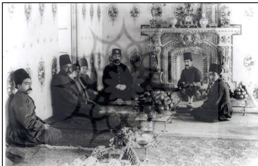
تصویر ۵. شومینه با کارکرد نمایی در خانه ایرانی. مهمانی درباریان در خانه صدراعظم (سال ۱۲۷۳ ه. ش)

تا اواسط حکومت ناصرالدین شاه، اثاث خانه ایرانی در طبقات مختلف بسیار محدود بود. میز، صندلی، تختخواب و پرده در خانه ایرانی معمول نبوده، چرا که کف برای منظورهای مختلف نشستن، خوردن و خوابیدن استفاده و کفشها قبل از ورود به اتاق، در کفشکن، گذاشته می‌شد. (Mostofi, 2007: 265) پس از سفرهای ناصرالدین شاه به مرور اسباب اروپایی به ایران راه یافت. تغییرات در اسباب و چیدمان خانه، ابتدا از کاخ‌های شاه و خانه درباریان آغاز گشت و اندک‌اندک وارد زندگی طبقه اعیان و بعد هم سایر اقشار جامعه شد.