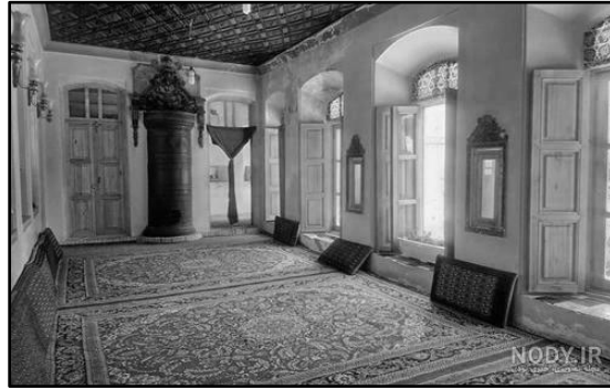
تصویر ۲. اتاقی در خانه سنتی ایرانی

خاصی مانند اسطبل، انبار، مطبخ و حمام، دیگر هیچ تفکیک کاربردی واقعی بین اتاق‌ها وجود نداشته است. حتی اتاق پذیرایی بخش اصلی مردان و زنان، می‌توانسته هم به عنوان محل غذا خوردن و هم برای خوابیدن مورد استفاده قرار گیرد. اگر تعداد میهمانان زیاد می‌شد، تختان‌ها، پشت‌بام‌ها و حتی رواق‌ها و ایوان‌ها هم می‌توانستند نقش اماکنی راحت را برای نشستن، غذا خوردن و خوابیدن ایفا کنند.»