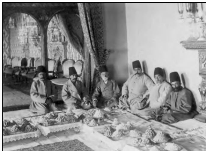
تصویر ۷. چند تن از شاهزادگان قاجار در مجلس عروسی در خانه علیرضا عضدالملک؛ صندلی‌ها در تالار چیده شده و شاهزادگان بر زمین نشسته‌اند.

با گذشت زمان و در چرخه بعدی تحول فضایی، شاهد شکل‌گیری نوعی دوگانگی رفتاری هستیم که در نظریه اشتورم به خوبی قابل تبیین است. در این مرحله ترکیب تازه‌ای از عناصر مادی و رفتار کنشگران حاصل می‌شود. عناصر مادی جدید به تدریج در فضاهای نیمه‌عمومی مانند اتاق‌های پذیرایی مهمانان جای خود را باز کردند، اما نتوانستند به حریم خصوصی‌تر یعنی اندرونی خانه‌ها راه یابند. همان‌طور که سرنا (Serena, 1983: 111) خاطرنشان می‌سازد، ایرانیان حتی در اوج تجددگرایی نیز در حریم خصوصی به الگوهای سنتی پایبند بودند. این وضعیت در واقع نشان‌دهنده مرحله‌ای از تحول فضایی است که در آن عناصر مادی جدید تنها بخشی از ساختار فضایی را دگرگون ساخته‌اند، در حالی که بیان فرهنگی در لایه‌های عمیق‌تر همچنان پایدار مانده است.