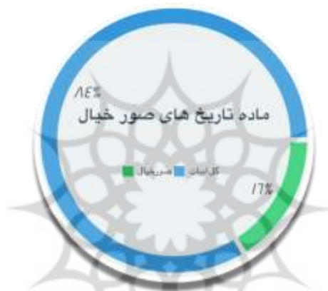
نمودار شماره‌ی ۲: نسبت ماده‌تاریخ‌های دارای صور خیال به کل

بسامد استفاده از صور خیال در دوران قاجار از سایر دوره‌ها بیشتر است و دلیل آن نیز حضور شاعران بازگشتی توانمند در این دوره، در شیراز است. نمودار بسامدی ماده‌تاریخ‌هایی که در آن‌ها از انواع صور خیال استفاده شده به صورت زیر است: