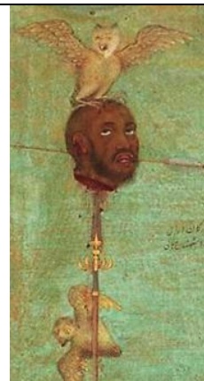
تصویر ۸- دو بوم بر سر ملک عنبر