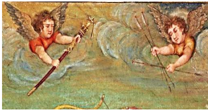
تصویر ۴- فرشتگان در بالای سر جهانگیر