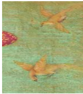
تصویر ۳- پرندگان در نزدیک جهانگیر