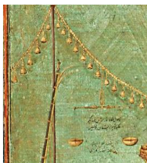
تصویر ۹- زنجیر عدل