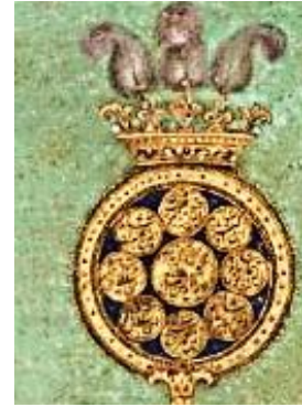
تصویر ۲- مهر فولادی

در قسمت فضا نیز دو فرشته از ابرها بیرون آمده‌اند و نیزه و شمشیر خود را به طرف جهانگیر گرفته‌اند (تصویر ۴). در این نگاره، پیکره مرکزی روی کره زمین ایستاده و مطابق با قدما، کره زمین روی شاخ گاوی قرار گرفته و آن نیز روی نهنگ (ماهی) دریا ایستاده است (تصویر ۵). روی کره زمین که شخص مرکزی ایستاده است، حیوانات اهلی و وحشی از جمله، شیر، بره، آهو و... در کنار یکدیگر قرار گرفته‌اند (تصویر ۶).