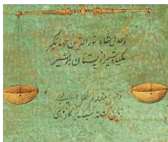
تصویر ۱۰- ترازو