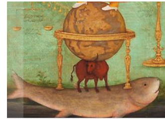
تصویر ۵- گاوماهی و کره زمین

در این اثر، شخصی که روی کره زمین ایستاده، زردپوست است و سری که بر چوبه دار قرار دارد، به رنگ سیاه است. شخص ایستاده روی کره زمین، سر سیاه‌پوست را نشانه گرفته و تیر دوم را به طرف او رها می‌سازد (تصویر ۷). روی نقاشی، این کلمات نوشته شده است: «خانه بوم شده کله شیرنگ نما، باطن که عدوت را چو خوک است، از خونس سپرسان تو سیر، الله اکبر، تفنگ شاه نورالدین جهانگیر، خطا نبود در او چون حکم تقدیر، کنند از سهم جان سپورش بمردم، زمین بوسی پلنگ و شیر بچتر». روبه‌روی کمان نوشته شده است: «هرگاه که در کمال درآئی، رنگ از رخ دشمنان ربائی». در پایین بین پادشاه و چوبه دار، بالای ترازو نوشته شده است: «عنبر بوم که از نور شاه گریزان شده بود... و بی‌حیا... بریده آورده بر نیزه نهاده تیراندازی فرمودند».