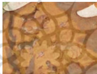
تصویر ۶- حیوانات روی کره زمین