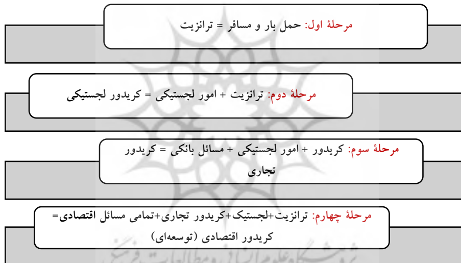
شکل ۴: ترسیم کریدور توسعه‌ای

هم به آن اضافه شود به آن کریدور لجستیکی گفته می‌شود. در مرحله بعد اگر به کریدور لجستیکی مسائل تجاری و بانکی نیز اضافه شود به آن کریدور تجاری گفته می‌شود. در مرحله نهایی به کریدور تجاری باید مسائل اقتصادی و انواع دیگر مسائل مالی را اضافه کنیم که این کریدور نهایی تمامی وجوه توسعه را در خود دارد. نتیجتاً باید گفت هدف غایی کریدورها رسیدن به کریدورهای توسعه‌ای است. فقط حمل و نقل امنیت نمی‌آورد در صورتی که کریدورها همه جوانب را داشته باشند- توسعه‌ای باشند و امنیت و رفاه اجتماعی و عدالت را در جامعه به ارمغان بیاورند به هدف مطلوب رسیده‌ایم.