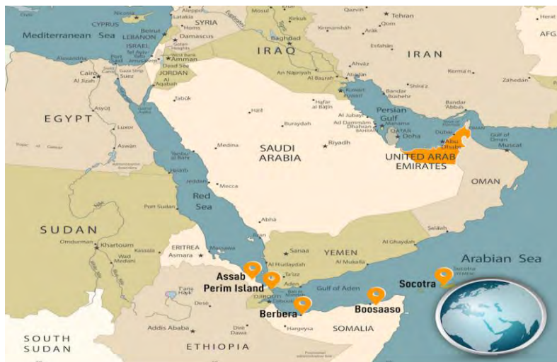
تصویر-۲. پایگاه‌های نظامی امارات در شاخ آفریقا (TELÇI & HOROZ, 2018: 145)