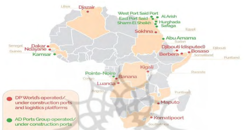
تصویر ۱- نقشه حضور امارات در بندر قاره آفریقا (Ardemagni, 2023)

قاره تقویت کرده‌اند. در حال حاضر، امارات متحده عربی چهارمین سرمایه‌گذار بزرگ در آفریقا پس از چین، کشورهای اروپایی و ایالات متحده است. تعداد شرکت‌های آفریقایی ثبت شده در اتاق تجاری دبی از سال ۲۰۱۹ با ۱۵٫۵ درصد افزایش در سال ۲۰۲۱ به ۲۴٫۸۰۰ رسید و آفریقا ۱۰ درصد از درآمد دی‌پی ورلد را تا سال ۲۰۲۱ تشکیل می‌داد. حضور امارات در زیرساخت‌های بندر آفریقا، مبتنی بر امتیازات نقشه‌برداری، ساخت‌وسازهای جدید، مناطق اقتصادی و پویایی رقابتی است (Ardemagni, 2023).