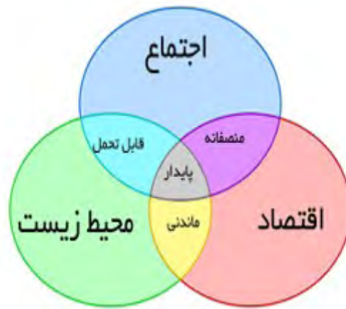
شکل ۱ ابعاد توسعه پایدار

این شرایط نشان می‌دهد که در اینجا پایداری فقط به اصطلاح نگهداری محیط طبیعی در یک وضعیت خوب تفسیر شده است و توسعه اقتصادی و اجتماعی در نظر گرفته نشده است. در حالی که در مفهوم توسعه پایدار، پایداری اقتصادی، محیطی و اجتماعی در کوتاه مدت و طولانی مدت، لاینفک هستند. مفاهیم پایداری اغلب از طریق این سه حوزه پایداری نشان داده می‌شوند که اشاره به ماهیت یکپارچه پایداری محیطی، اجتماعی و اقتصادی دارد. در یک نگاه کلی توسعه پایدار را می‌توان توازن و تعادل ابعاد پایداری در طول زمان دانست. بنابراین ذاتا توانایی اولویت بندی موضوعات اجتماعی، محیطی و اقتصادی را ندارند. زیرا موضوعات پایداری اغلب در تعارض با یکدیگرند (Farhadi, 2021: 2-3)