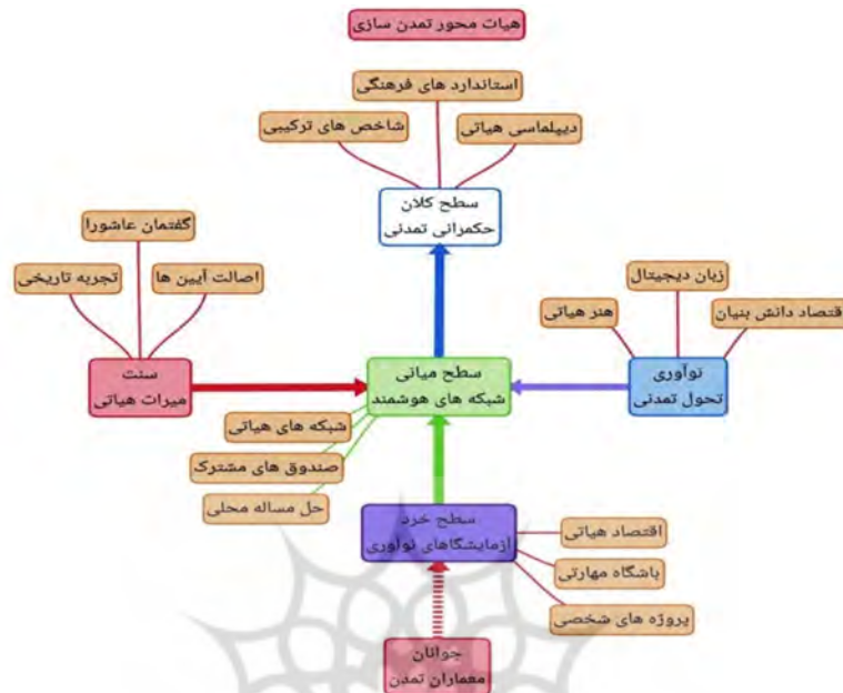
شکل-۲. مدل مفهومی سه سطحی هیأت مذهبی تمدن ساز