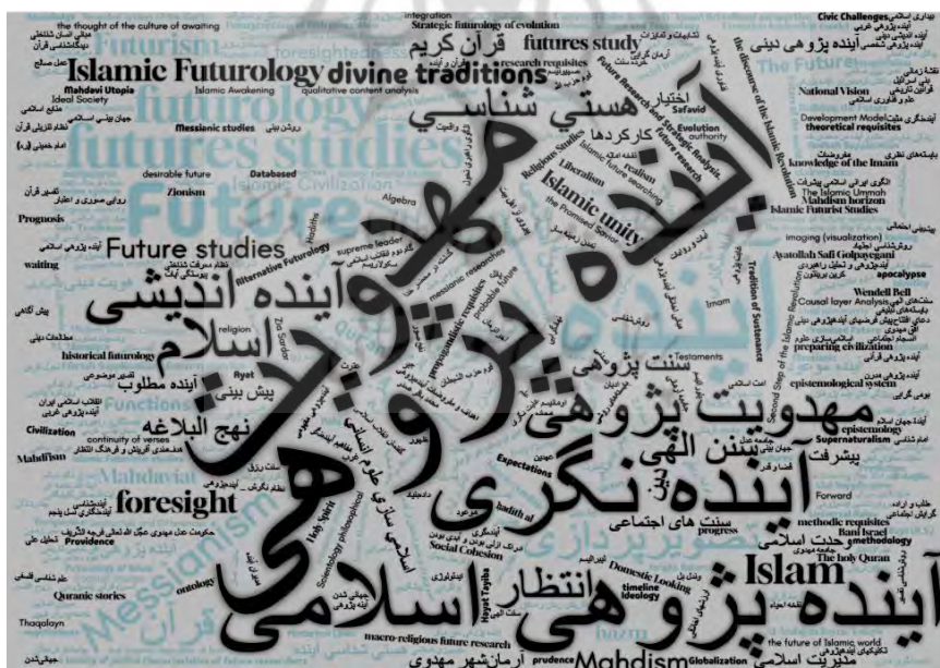
شکل ۱. ابرواژگانی