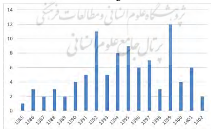
نمودار ۲. توزیع زمانی مقالات

در سال‌های ۱۳۹۲ و ۱۳۹۹، تعداد مقالات به ترتیب به ۱۱ و ۱۲ مقاله رسید که نشان‌دهنده نقاط اوج در این بازه زمانی است. سال ۱۳۹۹ با ۱۲ مقاله، بالاترین تعداد انتشار را در کل بازه مورد بررسی به خود اختصاص داده است. این اوج‌ها می‌تواند نشان‌دهنده تأثیر رویدادها یا تحولات خاص در آن سال‌ها باشد که باعث شده محققان بیشتر به این حوزه بپردازند. با توجه به روند کلی، به نظر می‌رسد حوزه آینده‌پژوهی اسلامی پتانسیل رشد بیشتری دارد. افزایش تدریجی تعداد مقالات در سال‌های اخیر نشان می‌دهد که این حوزه در حال توسعه است. با این حال، برای تحقق این پتانسیل، نیاز به حمایت بیشتر از سوی نهادهای علمی، تقویت همکاری‌های بین‌رشته‌ای و توجه به مباحث نوظهور در آینده‌پژوهی اسلامی احساس می‌شود. تقویت زیرساخت‌های پژوهشی و تشویق محققان به انجام مطالعات عمیق‌تر می‌تواند به رشد کیفی و کمی این حوزه کمک کند.