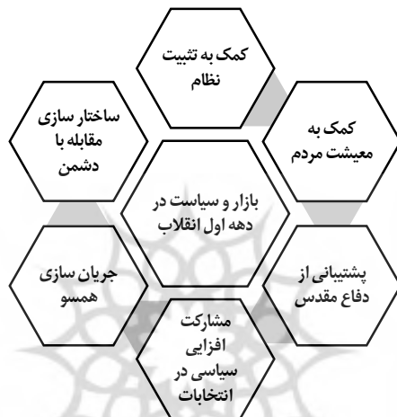
نمودار ۳-۴- نقش بازار در سیاست در دهه اول انقلاب

بخش مذهبی و انقلابی بازار تهران با توجه به چنین جایگاهی، در دهه نخست انقلاب، هم به لحاظ اتصال به روحانیت انقلابی و هم به واسطه شور و نشاط انقلابی و جهادی که بر فضای کشور حاکم شده بود در جهت حل مشکلات کشور و مقابله با توطئه‌های اقتصادی دشمنان فعالیت می‌کرد. آنان همچنین برای بسیج مردم در تحقق انتظارات نظام جمهوری اسلامی و حضور در صحنه‌هایی که نظام اسلامی به حضور مردم احتیاج داشت کمک نمودند.