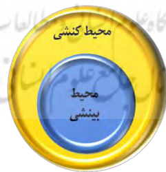
روش تحقیق (روش استنتاج شهید صدر)

حداقل دو نوع روش تفسیری وجود دارد که عبارت است از ترتیبی که مانند سوره‌های قرآن کریم از سوره حمد شروع شده و به سوره... ختم می‌شود و تفسیر به سوره سوره متوالی و آیه به آیه توسط مفسر تفسیر می‌شود، روش دیگر تفسیر، موضوعی بوده که در این نوع تفسیر، آیات قرآن