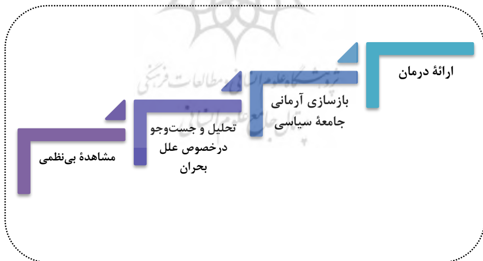
شکل (۳) محورهای نظریه توماس اسپریگنز (اسپریگنز، ۱۳۹۴، صص ۶۵ - ۸۴ و ۹۲، برزگر، ۱۳۸۳، صص ۴۹).

برای بررسی، تبیین و تحلیلی اندیشه‌های سیاسی و تحولات سیاسی اجتماعی در جوامع مختلف، اندیشه‌مندان روش‌ها و رهیافت‌هایی ارائه داده‌اند که یکی از ارزشمندترین آن‌ها متعلق به توماس اسپریگنز (Thomas Spragens) است. از دیدگاه او، هدف نظریات سیاسی فراهم ساختن بینشی همه‌جانبه از جامعه سیاسی با نگاهی انتقادی به‌منظور درک و فهم‌پذیر شدن آن و رفع نارسایی‌ها و کاستی‌های آن و بازگردان سلامت به جامعه از طریق مواجهه با ریشه‌های بی‌نظمی و غلبه بر آن‌ها است (اسپریگنز، ۱۳۹۴، صص ۲۲ - ۲۸) او در کتاب فهم نظریه‌های سیاسی بر این اعتقاد است که برای فهم نظریه سیاسی یک اندیشه‌مند باید چهار مرحله را طی کرد: