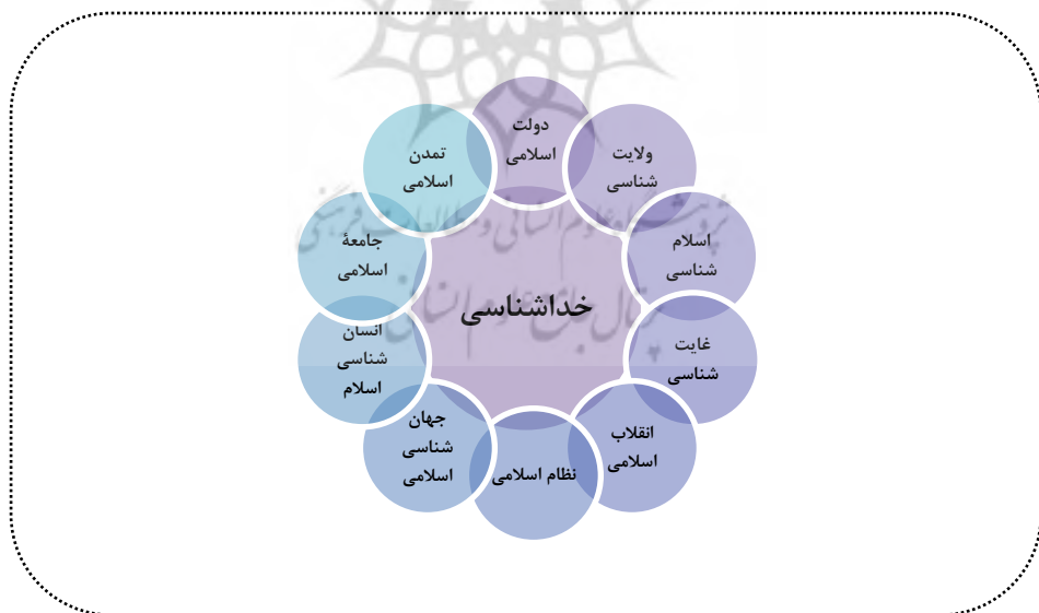
شکل (۲) شاکله‌ها و مبانی فکری و اندیشه سیاسی - اجتماعی رهبری انقلاب (مهاجرنیا، ۱۴۰۲، ص ۷۷۱، امامی و همکاران، ۱۳۹۹، صص ۳۲-۳۴).

نگرش، بینش، کنش و تحلیل افراد در حوزه‌های مختلف به‌طور مستقیم تحت‌تأثیر تحلیل و برداشت آن‌ها از مبانی هستی‌شناسی، انسان‌شناختی و فرجام‌شناختی قرار دارد. به عبارتی، تفاوت‌های فاحشی میان اندیشه‌مندان و محققانی که به خدا ایمان دارند و تمام عالم را به‌عنوان مخلوق و جلوه خداوند می‌نگرند و افراد ملحدی که هیچ اعتقادی به مبدأ و معاد ندارند و همه‌چیز را در متافیزیک (Metaphysics)، ماتریالیسم دیالکتیک (Dialectical Materialism) خلاصه می‌کنند، وجود دارد (خسروپناه و دیگران، ۱۴۰۳، صص ۳۵ - ۳۸). در منظومه فکری و نگاه مدیریتی مقام معظم رهبری، براساس سیره نوین - علوی و ایدئولوژی (Ideology) اسلامی، نظام هستی بر محور توحید استوار است و این اصل بر سطوح و ابعاد حیات سیاسی فردی و اجتماعی بشر تأثیرگذار است. نگرش «کثرت در عین وحدت» در این راستا مدنظر قرار دارد (مهاجرنیا، ۱۴۰۲، ص ۷۶۷). رهبر انقلاب در زمینه انسان‌شناختی به