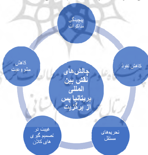
شکل ۲. چالش‌های نقش بین‌المللی بریتانیا پس از برگزیت

به‌طور کلی، نمودار زیر چالش‌های اصلی سیاست خارجی بریتانیا پس از برگزیت و تأثیرات آن بر نقش بین‌المللی این کشور را به‌طور خلاصه ترسیم می‌کند.