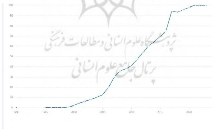
جدول ۱- تعداد کاربران اینترنت (درصد از جمعیت) عربستان سعودی

با هر انگیزه‌ای که باشد بر اساس آمار بین‌المللی این کشور در صدر رتبه بندی‌های جهانی قرار دارد به عنوان نمونه با شاخص اتصال جهانی ۹۴٫۷ و اتصال معنادار ۹۶٫۸ امتیاز کلی این کشور ۹۵٫۷ می‌باشد. همچنین بر اساس آمار ۲۰۲۲ کاربران اینترنت در این کشور ۹۶٫۸ از جمعیت کل این کشور را در بر می‌گیرد. ۱۰۰ درصد خانوارها به اینترنت خانگی دسترسی دارند (جدول-۱)