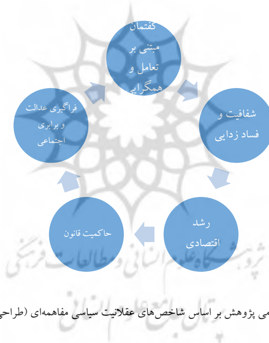
شکل ۱. مدل مفهومی پژوهش بر اساس شاخص‌های عقلانیت سیاسی مفاهمه‌ای (طراحی: نویسندگان)

به طور کلی، سه شاخص مهم دموکراسی گفتگویی هابرماسی که با دموکراسی رایج در سه حوزه مهم تفاوت‌های بنیادین دارند عبارتند از: نخست؛ در دموکراسی گفتگویی هابرماسی، حوزه زیست-جهان‌بازسازی مورد بازسازی اساسی قرار گرفته است؛ دوم؛ زبان یا نیروی زبانی ماهیتی عقلانی داشته و به مثابه تنها ابزار نیل به اجماع و تفاهم عقلانی محسوب می‌شود؛ ج. مشارکت‌کنندگانی که همگی در یک سطح مشابه «زبان» را به کار می‌گیرند به سمت «اجماع جهت‌گیری شده» سوق خواهند یافت (عالم و پورپاشاکاسین، ۱۳۹۰: ۱۵۳).