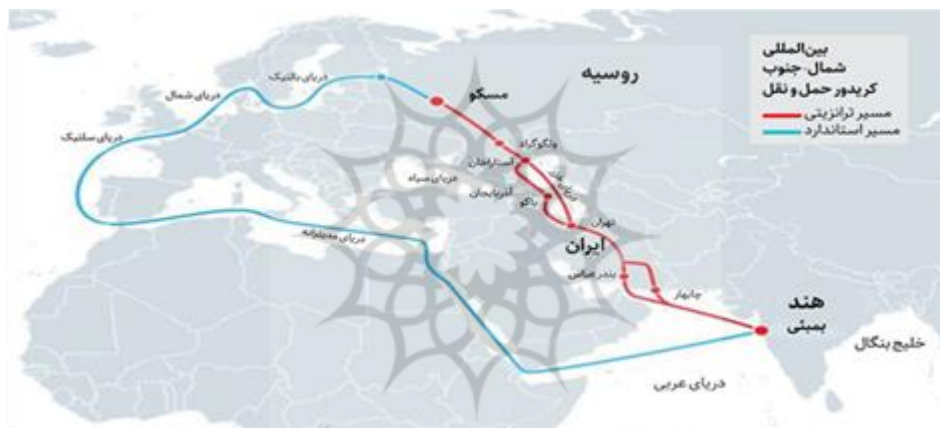
شکل ۱: مسیر راه‌گذر شمال و جنوب

ضرورت ژئواکونومیکی دیگری که تعیین‌کننده جایگاه روسیه در سیاست نگاه به شرق به‌شمار می‌آید، فعال‌سازی مسکو در حوزه حمل و نقل (راه‌گذر شمال و جنوب) است. سه کشور ایران، روسیه و هند در سال ۲۰۰۰ در مورد راه‌گذر شمال و جنوب به‌عنوان مسیر اتصال شمال اروپا، روسیه و دریای خزر (جمهوری آذربایجان)، ایران، خلیج فارس، دریای عمان و شبه‌قاره هند توافق کردند. این راه‌گذر بنا بود بر پایه حمل‌ونقل ترکیبی جایگزین حمل‌ونقل سنتی دریایی شود (Sarma, 2018: 124-138) (شکل ۱).