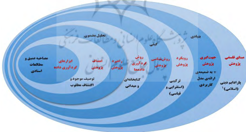
شکل ۲: الگوی مفهومی پژوهش

پارادایم اسلامی قوام یافته است. در این نوشتار پارادایم اسلامی در خصوص ماهیت انسان، ماهیت علم و داده‌های آن، واقعیت اجتماعی، با مراجعه به قرآن و روایات و اندیشه صاحب‌نظران اسلامی، منشأ و حیانی و هویت مستقل در کنار اثبات‌گرایی، تفسیرگرایی و انتقادگرایی مطرح است. انسان در این رویکرد دارای ساحت‌هایی است که دین، جهت‌دهی آن را عهده‌دار است. حس، عقل، شهود و وحی ابزارهای شناخت بوده و شناختی که از حواس آدمی حاصل می‌شود، زمینه‌ساز تحقق معرفت تحلیلی است. انسان دارای سرمایه‌های بالقوه و بالفعل درونی است و خلقت نیز سرمایه‌های زیستی- فرهنگی، اجتماعی متفاوتی در اختیار انسان قرار می‌دهد و از این‌گذر، هویت آدمی شکل می‌گیرد. در خصوص واقعیت اجتماعی در پارادایم دینی، هم به عامل با اراده و کنشگر فعال و هم به وجود ساخت‌های اجتماعی و فضای منبعث از آن‌ها و تأثیر آن‌ها بر فرد توجه می‌شود. جهت‌گیری این پژوهش بنیادین و بر اساس رویکرد ترکیبی و استفاده توأمان از نگاه استقرایی و قیاسی و مبتنی بر روش‌شناسی کیفی پیش رفته است. روش گردآوری داده کتابخانه‌ای و میدانی و مبتنی بر راهبرد تحلیلی داده‌ها بر اساس روش تحلیل مضمون با هدف توصیف وضع موجود و اکتشاف روش فهم مطلوب برنامه‌ریزی شد. در این مسیر از ابزارهای گردآوری داده مصاحبه عمیق و مطالعات اسنادی استفاده گردید. در یک نگاه، پیاز این پژوهش و درون‌مایه اصلی آن در شکل (۲) ترسیم شده است: